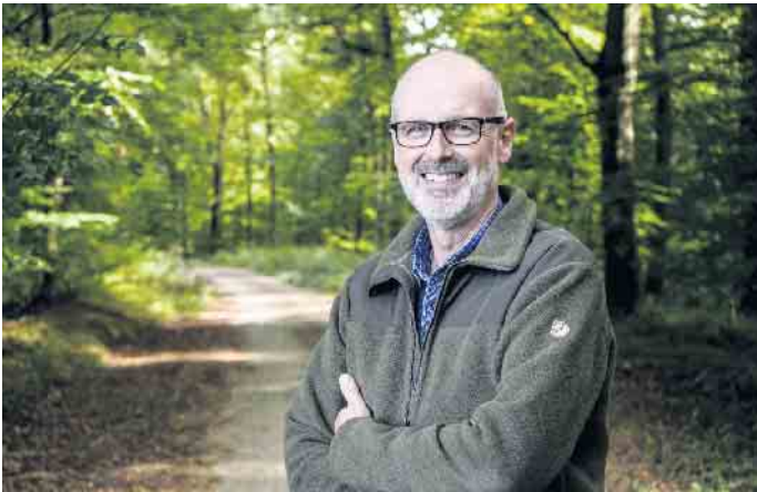
Wohllebens Waldakademie.

Johanniter und Peter Wohlleben bieten Menschen im Flutgebiet spannende neue Aktionstage an.