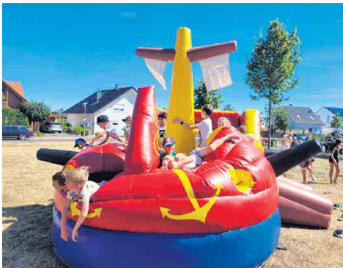
und das Piratenschiff gut besucht