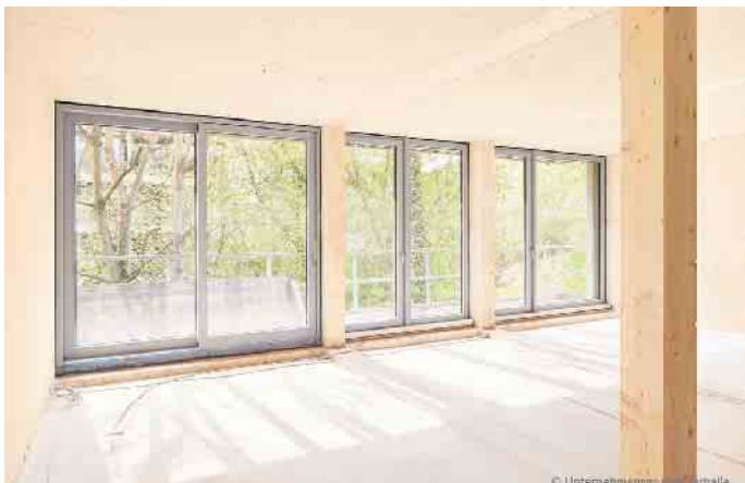
Lichtdurchflutete Räume, eingerahmt von eleganter Metall-Optik: Fensterrahmen aus einem Aluminium-Holz-Verbund bieten viele Gestaltungsmöglichkeiten gerade für großformatige Fenster.

aus zwei Welten zu verbinden. Ein Kunststofffenster mit einer äußeren Aluminiumdeckschale schafft noch mehr Raum für individuelle Gestaltung als die pure Kunststoff-Alternative. Denn angrenzende Materialien wie Fensterbänke oder Sonnenschutzanlagen sind meist aus Aluminium und lassen sich dann