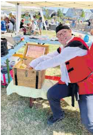
Im letzten Jahr war der Schatz gut behütet