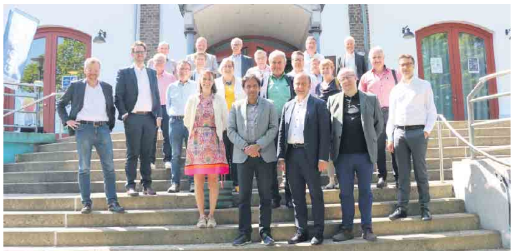
Energieagentur Rhein-Sieg: Anfang Juni trafen sich die Mitgliedskommunen der Energieagentur zur jährlichen Mitgliederversammlung in der Hennefer Meys Fabrik.