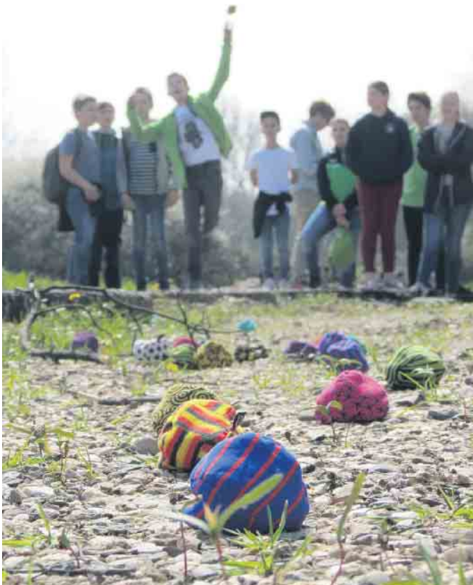
Boulen über Stock und Stein

Für diese Gruppe ist eine Anmeldung erforderlich: 02226/900 433 und kontakt@hospiz-voreifel.de . Weitere Informationen zum Verein finden Sie unter: www.hospiz-voreifel.de