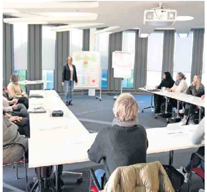
Zu einer guten Einarbeitung können auch Schulungen gehören, in denen Wichtiges über die Firma oder spezifische fachliche Anforderungen vermittelt werden.

Gerade in der Pflegeberatung seien außerdem gute Kommunikationsfähigkeiten wichtig: „Wir brauchen Leute, die sich austauschen und Interesse am Gegenüber haben. Denn wir müssen für eine gute Beratung auch viel zuhören und die Bedarfe der Menschen wahrnehmen.“ (DJD)