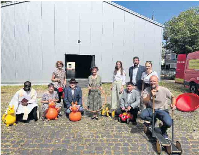
Mit Unterstützung der Hilfsorganisationen Johanniter und Malteser steht den Flerzheimern auf dem Dorfplatz wieder ein Veranstaltungsort und Treffpunkt für das Gemeinschaftsleben zur Verfügung.

gionalvorstands der Johanniter in Bonn/Rhein-Sieg/Euskirchen: „Bald naht zum vierten Mal der Jahrestag der Flutkatastrophe. Wir Johanniter wollen mit dieser Projektförderung ein weiteres Zeichen setzen, dass wir die Menschen und die Region auf ihrem langen Weg zum Wiederaufbau unterstützen und weiter für sie da sind. Hier kann man hervorragend erkennen, welche positive und wichtige Wirkung wir entfalten können. Vielen Dank an alle Beteiligten, die die erfolgreiche Umsetzung ermöglicht haben.“ Johanniter und Malteser haben die finanziellen Mittel für die neue Leichtbauhalle in Flerzheim bereitgestellt. Unterstützt wurde dieses Projekt von den Johannitern mit 289.016 Euro. Die Malteser beteiligen sich mit 125.000 Euro. Die Mittel wurden über das Bündnis Aktion Deutschland Hilft bereitgestellt. Privatpersonen und Vereine, die durch die Flutkatastrophe 2021 betroffen sind, können weiterhin Unterstützung im Rahmen der Hochwasserhilfe der Johanniter in Anspruch nehmen. Die Hilfsangebote reichen von finanzieller Einzelfallhilfe bis hin zu beratender Unterstützung. Bei Fragen oder zur Antragstellung steht das Team der Johanniter gerne zur Verfügung. Kontakt: hochwasserhilfe.bonn@johanniter.de oder telefonisch unter 02241 89538660.