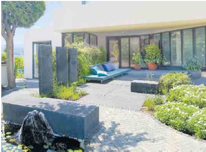
Anthrazitfarbene EXEO®-Platten, Stelen und Sitzblöcke in Kombination mit TARA®-Pflaster Platin.