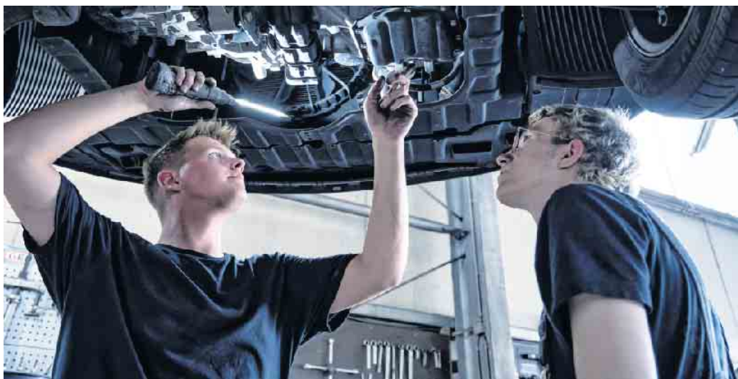
Beim Klimaanlagen-Check prüft der Kfz-Mechaniker alle Teile der Anlage und ihre Funktionen.

Der Zentralverband Deutsches Kfz-Gewerbe weist auf Probleme hin, die durch eine mangelhafte Wartung entstehen können. Ein niedriger Stand des Kältemittels etwa kann die Leistung beeinträchtigen und zu Schäden am Kompressor der Klimaanlage führen - die Reparatur geht richtig ins Geld. Ein Austausch der Innenraumfilter nach Hersteller-