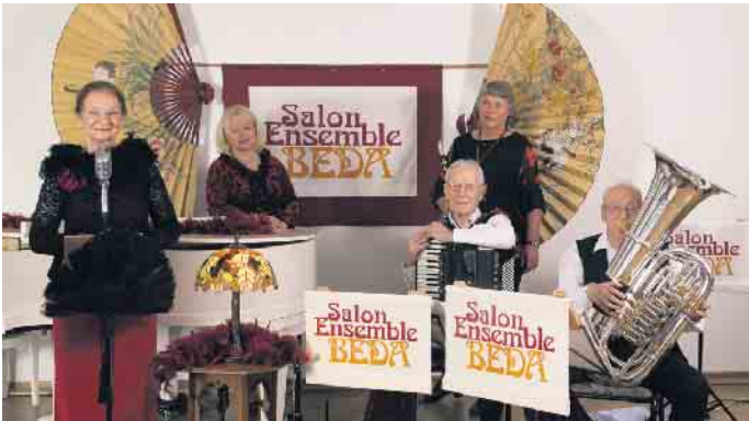
Das Salon Ensemble Beda spielt zugunsten der Ökumenischen Hospizgruppe

Wer kann nicht mitsingen oder mitsummen, wenn diese unsterblichen Stücke erklingen: „Mein kleiner grüner Kaktus“ oder „Ein Freund, ein guter Freund“. Beim Benefiz-Konzert zugunsten der Ökumenischen Hospizgruppe e.V. lässt das Salon Ensemble Beda eine ganze Reihe dieser populären Musikstücke erklingen: am Sonntag, 6. Juli , 17 Uhr, in der Schützenhalle in Meckenheim, Schützenstr. 2, Eintritt frei, Spenden erbeten. Das Besondere: Die Moderation beleuchtet mit interessanten Informationen Zeithintergrund und Entstehung der Chansons.