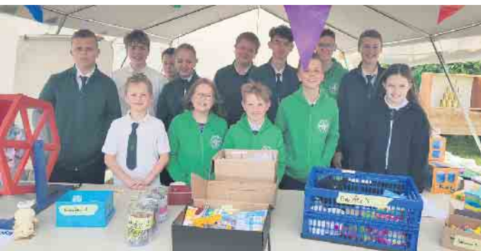
Die Schützenjugend hatte ein vielseitiges Kinderprogramm vorbereitet.