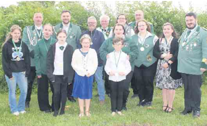
Die Sieger der Schießwettkämpfe mit dem Luftgewehr oder Blasrohr.

Besonders viele Familien aus Altendorf-Ersdorf nutzten die Gelegenheit, gemeinsam zu feiern und trugen so maßgeblich zur gelungenen Festatmosphäre bei.