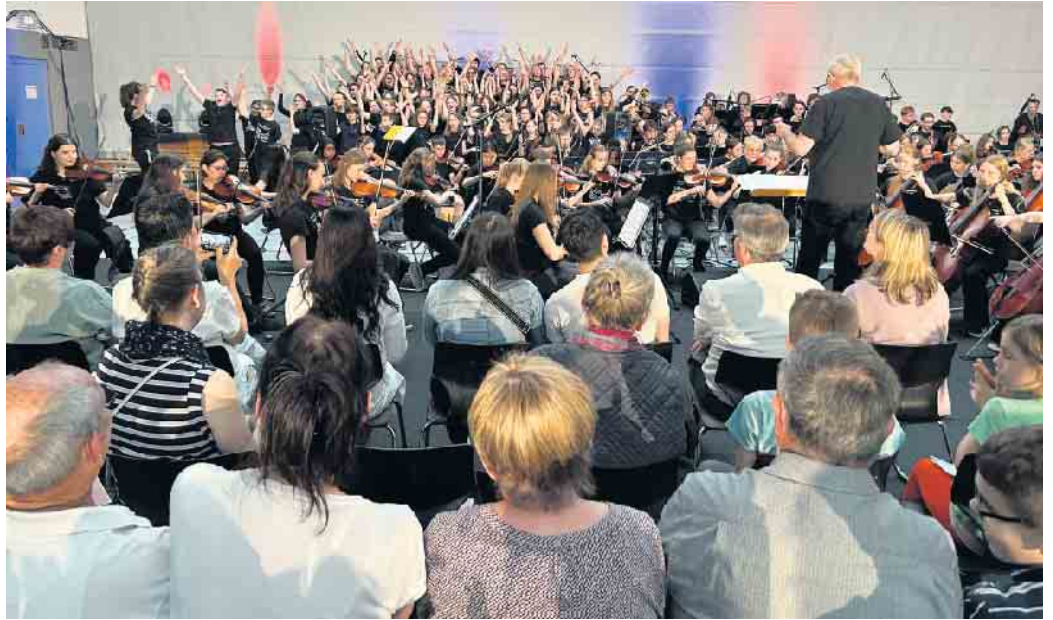
Die Chöre und Musikensembles des St. Joseph-Gymnasium gestatteten gemeinsam ein unterhaltsames Konzert mit klassischen Stücken und Werken aus Pop, Rock, Musical und Swing.