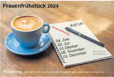
Frauenfrühstück in Christlicher Gemeinde Meckenheim

Dienstag 16:30 - 18:00 Uhr: Kids-Treff (5-11 Jahre) Freitag Treffen für Teens (Info zu Zeiten & Themen s. Website) Vorschau: Dienstag, 02. Juli 2024 09:00 Uhr Frauenfrühstück (Anmeldung unter 02225 - 7 09 99 13 oder