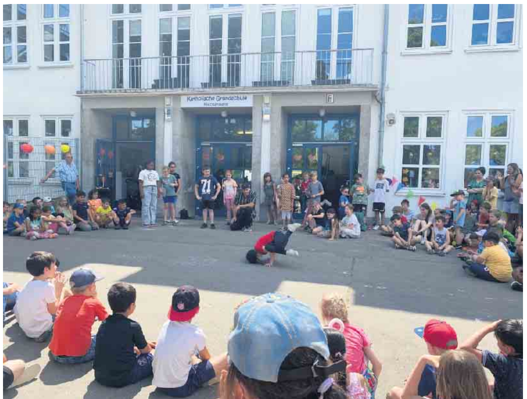
Die Breakdance-Gruppe zeigte, wie großartig sie tanzen können.