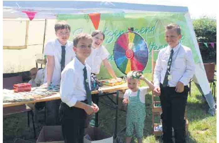
Die Jugendabteilung kümmerte sich um das Kinderprogramm.

schaft packten tatkräftig mit an, um für die Gäste eine gelungene Veranstaltung auf die Beine zu stellen. Auch ein kurzfristiger Engpass beim Frittenvorrat konnte schnell gelöst werden. Neben herzhaftem Essen lud die Kuchentheke viele Gäste ein und auch Eis fehlte an diesem war-