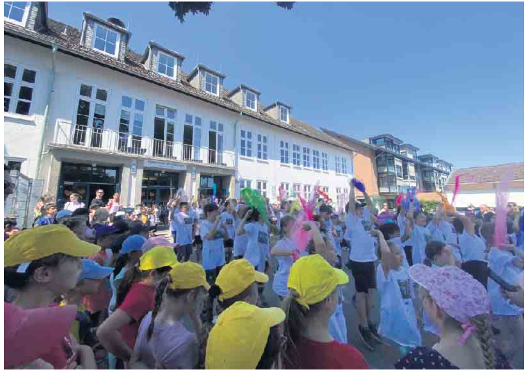
Die Viertklässler tanzten am Ende des Wandertages für die Schulgemeinschaft, die sich auf dem Schulhof traf und gemeinsam den Abschluss des schönen Tages feierte.