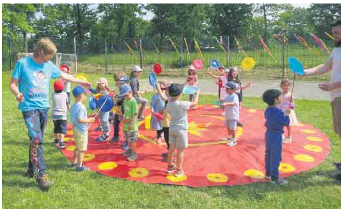
Fleißig probieren sich die Kinder am Tellerdrehen.