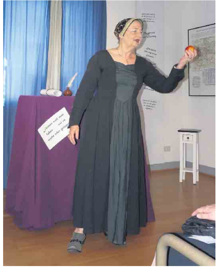
Katharina in Aktion.

das Wort zu ergreifen, tat das auch tatsächlich. Und so konnten die Besucher und Besucherinnen im ehrwürdigen Saal des Herrenhauses einen furiosen Auftritt der Katharina Luther erleben und ihren tief sinnigen Tischreden lauschen. Dabei nahm die ehemalige Nonne kein Blatt vor den Mund und ließ den vormaligen Mönch, emanzipatorisch selbstbewusst, schließlich hätte sie inzwischen schon Äbtissin sein können, wie sie anmerkte, wissen, was sie von ihrer Ehe, ihm als Mann sowie Martin Luther als Berühmtheit und Vorbild hielt.