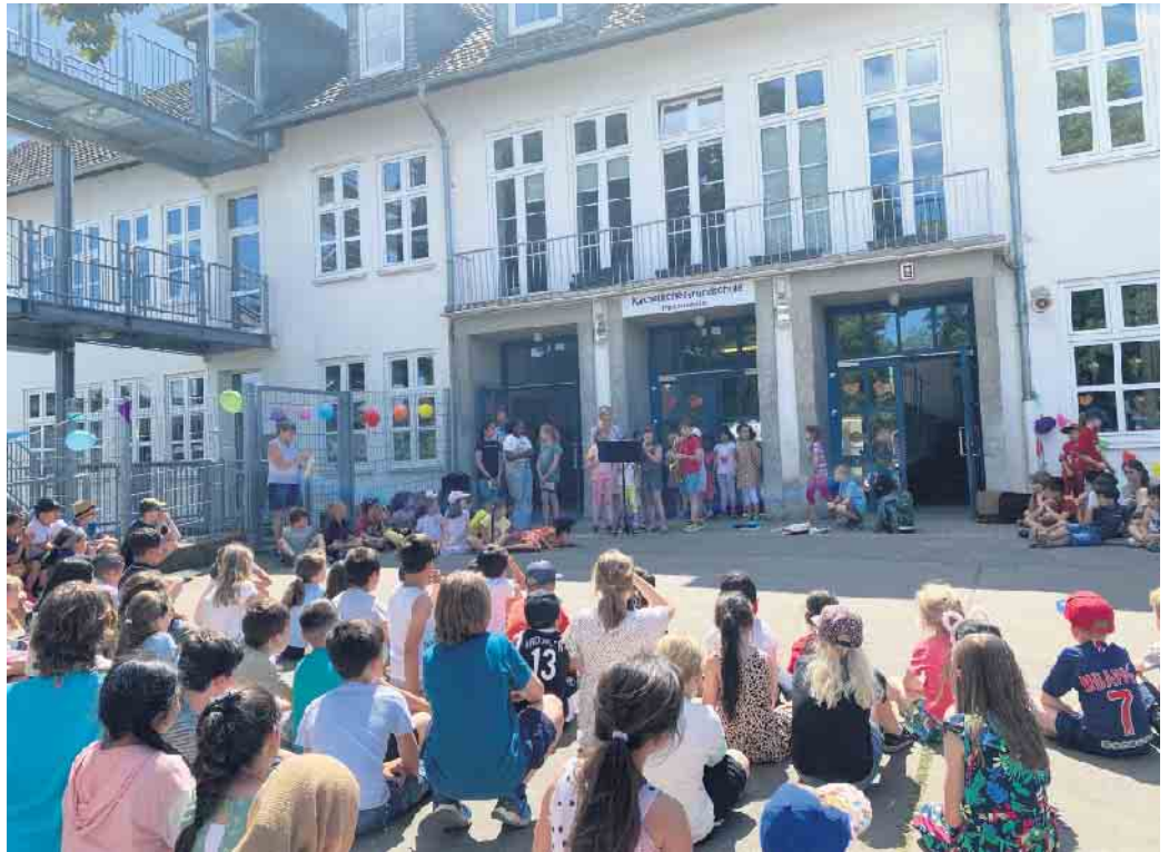
Die Kinder präsentierten ihr musikalischen Können auf den Blasinstrumenten.

die kreativen Potenziale ihrer Schülerinnen und Schüler zu fördern.