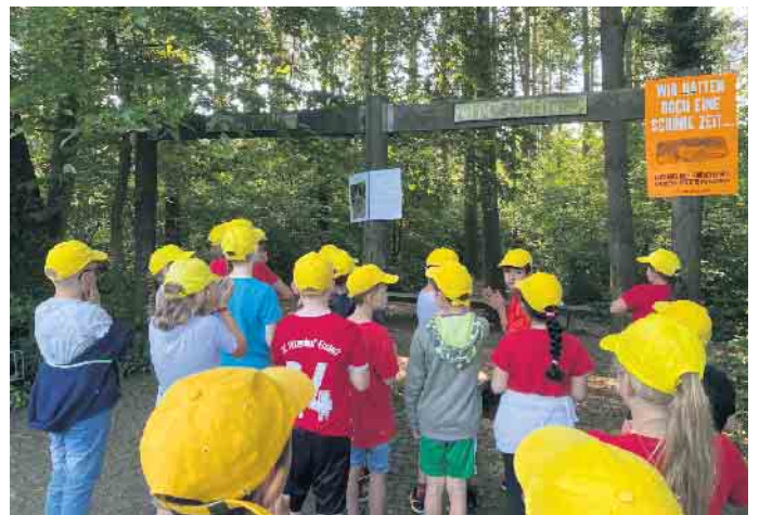
Die Drittklässler wanderten zur Finnenbahn, wo die Kinder mit einem Yogaweg überrascht wurden, der eigens für sie erstellt wurde.

einmal mehr verdeutlichen.“ Am Ende trafen sich alle auf dem Schulhof wieder, wo die Eltern auf sie warteten. Dort stellte jede Stufe den anderen vor, was sie an dem Tag gemacht hatten. Ein schöner Abschluss für einen gelungenen Wandertag, bei dem die Schülerinnen und Schüler nicht nur ihre körperliche Gesundheit gefördert haben, sondern auch Gemeinschaftssinn und Zusammenhalt gestärkt wurden. Insgesamt war der Wandertag ein voller Erfolg und ein wichtiger Beitrag zur Förderung von Bewegung und Gesundheit bei den Schülerinnen und Schülern der KGS Meckenheim.