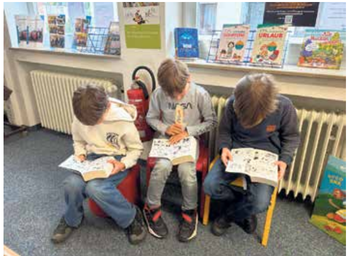
Hier liest man andersherum: Die Jungs aus der Bienenklasse haben die japanischen Comics für sich entdeckt.

Mangas unterscheiden sich deutlich von westlichen Comics. Sie werden von rechts nach links gelesen und erscheinen meist im handlichen Taschenbuchformat. Typisch ist der schwarz-weiße Zeichenstil mit großen, ausdrucksstarken Augen und detaillierten Hintergründen. Dynamische Panels, sogenannte Speed Lines, und lautmalersche Effekte sorgen für ein fast filmisches Leseerlebnis. Ein großer Pluspunkt ist die Vielfalt: Ob Abenteuer (Sh-nen), Romantik (Sh-jo) oder ernstere Themen für ältere Leserinnen und Leser - Mangas bieten für jeden Geschmack etwas. Gleichzeitig vermitteln sie Einblicke in die japanische Kultur und erzählen oft von Alltag, Freundschaft und gesellschaftlichen Themen. Das neue Angebot zeigt Wirkung: Viele Kinder entdecken durch Mangas ihre Freude am Lesen neu. Die Kombination aus Bild und Text erleichtert den Einstieg und sorgt für schnelle