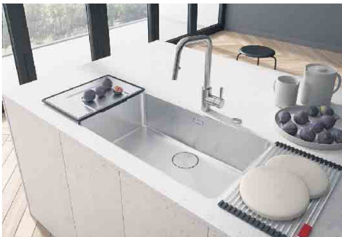
Blickfang Spüle: Filigran, zeitlos elegant und gefertigt mit höchster Präzision ist dieses Edelstahlbecken mit seinem nur 6 mm schmalen Rand. Passgenau gefertigt ist auch das Zubehör: die Rollmatte und das mobile Tropfteil. (Foto: AMK)

zu außergewöhnlichen Farbstellungen findet sich für jedes Küchendesign das passende Modell. Und wer eine besonders nachhaltige Granitspüle sucht, der wird auch in dieser Disziplin fündig: z. B. eine Spülenmaterialität, die zu 99 Prozent aus natürlichen, nachwachsenden oder recycelten Rohstoffen besteht und nach einem langen Lebenszyklus wieder in einen geschlossenen Recycling-Kreislauf zurückgeführt werden kann. „Neben ihren besonderen Gebrauch- und Materialeigenschaften überzeugen moderne Spülen insbesondere auch aufgrund ihrer hohen Funktionalität. Hinzu kommen ein außergewöhnliches Design und eine sehr angenehme Haptik. Ob es nun eine formschöne Edelstahl-, Keramik- oder Granitspüle wird, seine finale Kaufentscheidung sollte man am besten in einem Küchenstudio oder in einem Möbelhaus treffen“, empfiehlt AMK-Geschäftsführer Volker Irlé. (AMK)