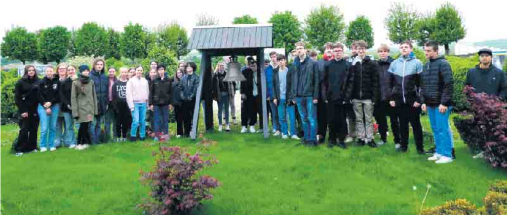
Gruppe vor der Friedensglocke von Verdun