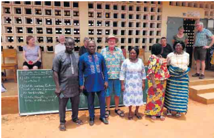
Lehrerkollegium mit einer Kreidetafel aus dem SGR