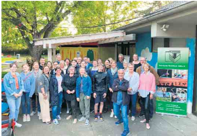
Fröhliche Stimmung beim ersten Ehrenamtsfest

Der Turn-Verein Rheinbach führte am 20. Mai sein erstes Ehrenamtsfest durch. Ohne den unermüdlichen Einsatz der vielen ehrenamtlich Tätigen ist der Sportbetrieb des Vereins nicht möglich. Von ganz besonderer Bedeutung war dies während der langen Einschränkungen im Sportbetrieb aufgrund von Corona. Daher sollte mit dem Fest denen gedankt werden, die mit ihren ehrenamtlichen Tätigkeiten im und für den Verein den Sportbetrieb großartig sicherstellen. Gut gelaunt und bei gutem Wetter traf man sich im Café Park Plätzchen im Freizeitpark und verbrachte