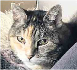
53424 Remagen. Tel. 02642/21600. Spendenkonto: Tierheim u. Tierschutzverein Kreis Ahrweiler e.V., KSK Ahrweiler IBAN DE14 5775 1310 0000 4107 87 + VoBa IBAN DE74 5776 1591 0201 8159 0

Die fast 16-jährige Katzenomi Sunny sucht dringend ein schönes, ruhiges Zuhause, in dem keine anderen Katzen oder Hunde leben. Zu Menschen ist Sunny ganz lieb. Anfangs ist sie etwas schüchtern, aber das gibt sich recht schnell. Dann schmust Sunny auch gerne. Also, wenn Ihr einer netten Omi noch eine schöne Zeit machen wollt, ihr einen ruhigen Freigang oder eine schöne Wohnung mit gesichertem Balkon o.ä. und gaaanz viel Zeit geben könnt, ruft schnell im Tierheim an und macht einen Termin zum Kennenlernen aus. Mehr Infos über Sunny gibt es hier: www.tierheim-remagen.de . Blankertshohl 25,