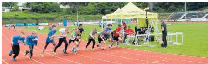
Die Jungen der Wettkampfkategorie III beim 800-Meter-Lauf.