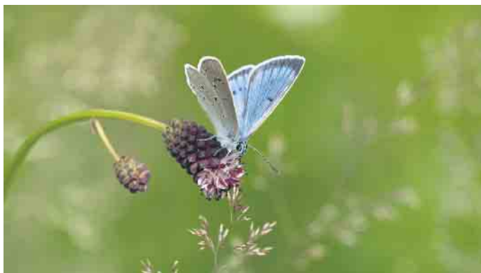
Heller Wiesenknopf-Ameisenbläuling.

senknopf, fehlte, wurden rund 2.800 nachgezogene Pflanzen ausgebracht. Insbesondere durch die trockenen Sommer und Einschränkungen durch die Coronapandemie sind die Projektziele allerdings noch nicht hinreichend erfüllt. Daher wird das Projekt bis Ende 2025 verlängert. Die Nordrhein-Westfalen-Stiftung konnte seit ihrer Gründung 1986 rund 3.500 Natur- und Kulturprojekte mit insgesamt über 300 Millionen Euro fördern. Das Geld dafür erhält sie vom Land NRW aus Lottereerträgen von Westlotto, aus Mitgliedsbeiträgen ihres Fördervereins und Spenden. Mehr Informationen auf www.nrw-stiftung.de und im neuen Podcast „Förderbände“.