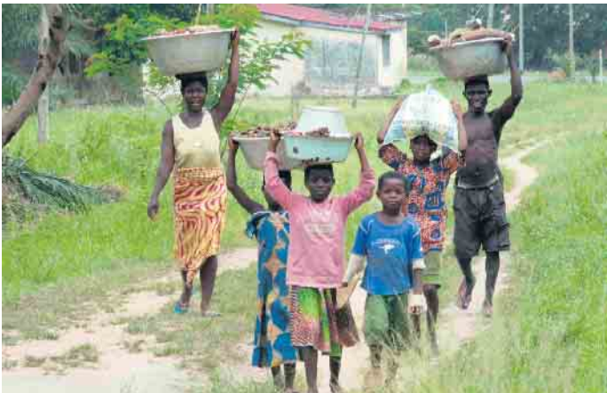
Kinder müssen mitarbeiten