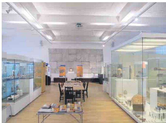
So sieht es noch am alten Standort aus

schliessendlich werden alle Objekte transportfähig eingepackt. Da am neuen Standort die zur Verfügung stehende Ausstellungsfläche deutlich kleiner ist, wird schon beim Einpacken darauf geachtet, was in die erste Ausstellung (voraussichtlich im Mai 2024) geht und was in das Archiv wandert. Die Schließung des Museums am jetzigen Standort ist für Juni/Juli 2023 vorgesehen. Bis zum Jahresende sind aber noch Führungen und Kinderveranstaltungen vorgesehen. Die Termine für diese Aktionen werden rechtzeitig bekannt gegeben.