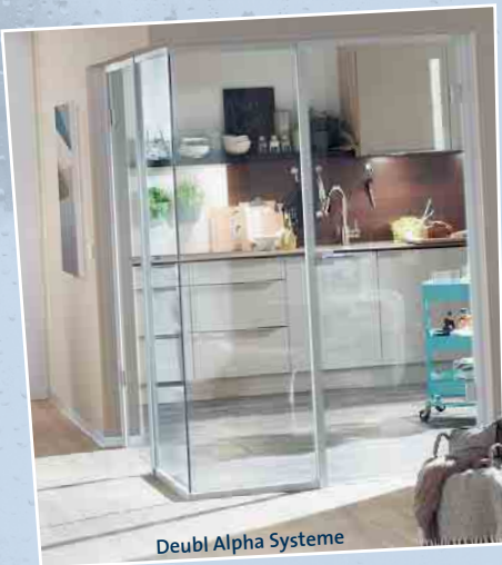
Deubl Alpha Systeme

Eine Wandverkleidung aus Glas bietet Ihnen eine einfach zu reinigende und damit hygienische Oberfläche, z.B. als Küchenrückwand. Schmutzflecken, wie Fettspritzer oder Ähnliches, lassen sich mühelos von der glatten Glasoberfläche mit einfachen Reinigern abwischen.