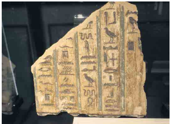
Hieroglyphen auf originalem Objekt

Im Ägyptischen Museum findet eine Schnipsel Jagd statt. Die Hinweise und Wege werden allerdings in Hieroglyphen Schrift verfasst. Hierzu gibt es eine Einführung in die Zeichenschrift der frühen Ägypter. Die erforschten Wege führen zu einem „Schatz“, einem wertvollen Geschenk. Die Teilnehmer Zahl müssen wir auf