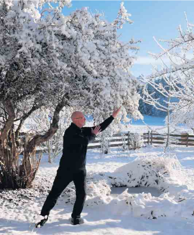
Gymnastische Atemkraftübung „Das Windspiel“

VFG Meckenheim startet neue Reha-Sportgruppe für pneumologische Erkrankungen