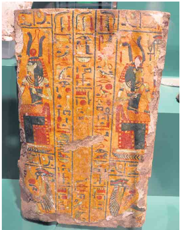
Steht hier die Lösung zur Schatzsuche?