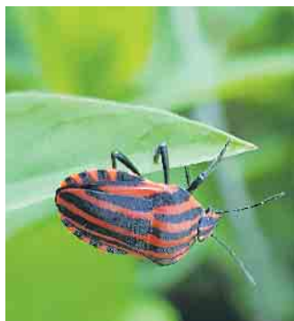
Der Schaugarten bietet Lebensraum für zahlreiche Insekten

Mehr Informationen zum Schaugarten unter www.schaugarten-wachtberg.de