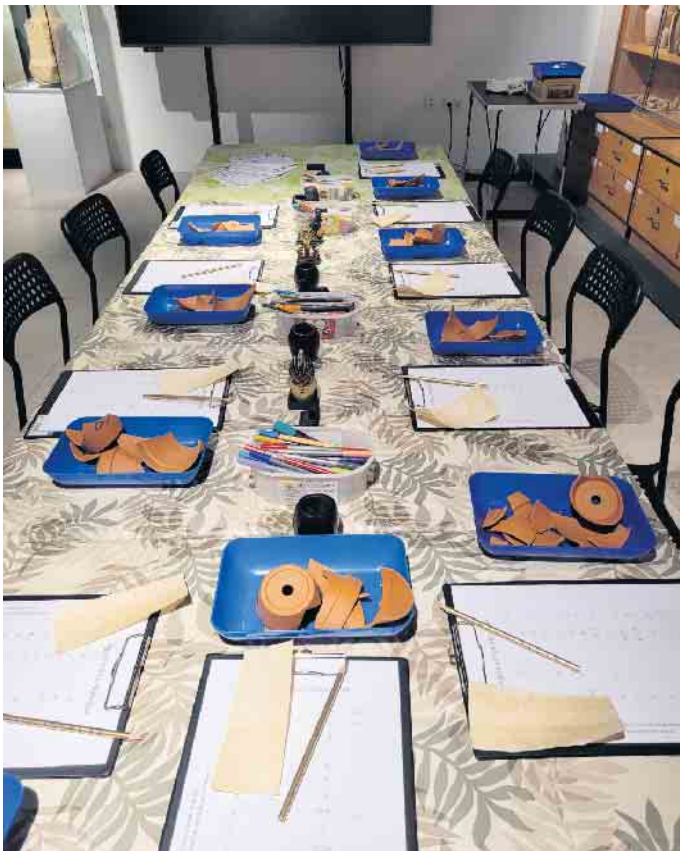
So kann der Keramik-Kurs starten

Die Kursdauer beträgt jeweils gute zwei Stunden. Alle Kurse finden in der Poststraße 26 in 53111 Bonn statt. Der Kostenbeitrag ist bar an der Museumskasse im Erdgeschoss zu entrichten. Das Museum ist barrierefrei. Der Förderverein freut sich auf euren Besuch.