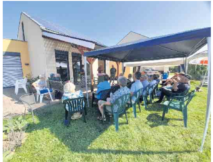
Netzwerk Info-Treffen in Swisttal-Morenhoven 2024

anstaltungsorten und die genauen Termine und Ansprechpartner finden Sie unter www.klimapatennetzwerk.de .