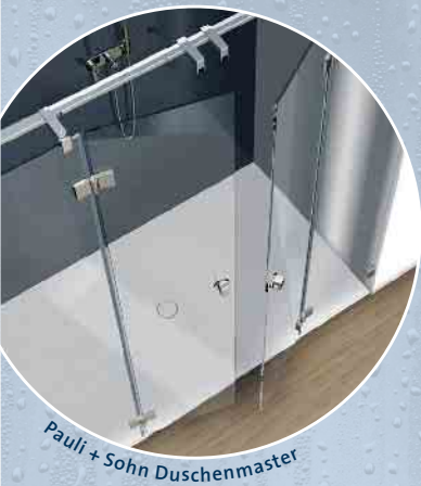
Pauli + Sohn Duschenmaster

Wir bieten Ihnen maßgefertigte Trennwandsysteme als Flächen- und Raumteiler aus Glas. Ohne Verlust von Licht und Transparenz schaffen wir für Sie einzigartige Raumaufteilungen.