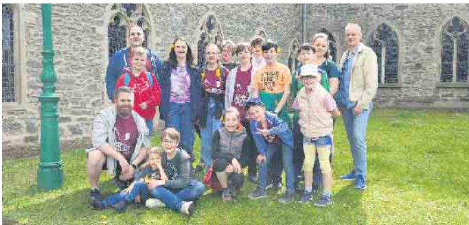
Aus Altendorf-Ersdorf waren 17 Teilnehmerinnen und Teilnehmer nach Beyenburg gereist.