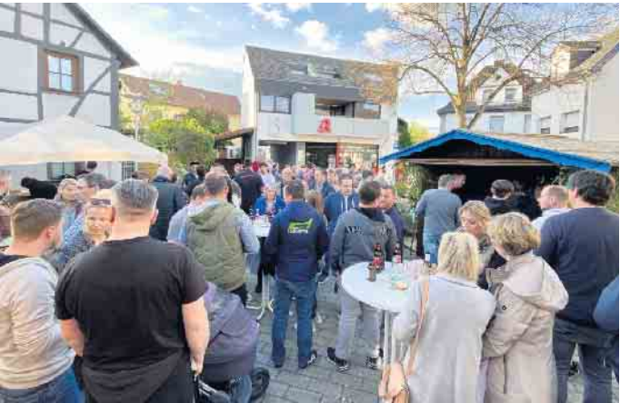
Auch 2023 wurde in Merl in den Mai getanzt