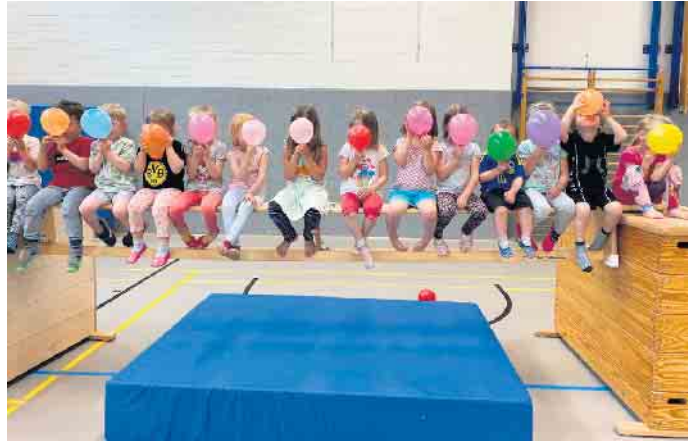
Kindersport beim MSV in großer Vielfalt

das Körper- und Rhythmusgefühl und stärken das Selbstbewusstsein des Kindes. Beim Erlernen der Schritte werden Koordination und Kondition weiterentwickelt. Die Dance-Minis trainieren donnerstags von 14 bis 14:45 Uhr im Spiegelsaal des MSV Sportforums am Neuen Markt 46 in Meckenheim. Da die Teilnehmerplätze begrenzt sind, bitten wir um frühzeitige Anmeldung über die MSV Geschäftsstelle telefonisch unter: 02225-6925 oder per Mail an: jazzdance@msv-meckenheim.de