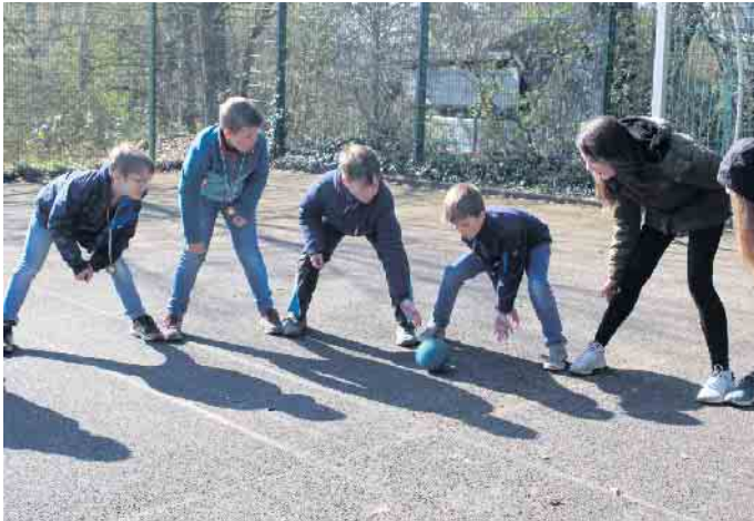
Spiele und Action kamen nicht zu kurz

Deshalb sucht das Team immer nach Möglichkeiten der Finanzierung, damit die Kosten kein Ausschlusskriterium für Familien darstellen.