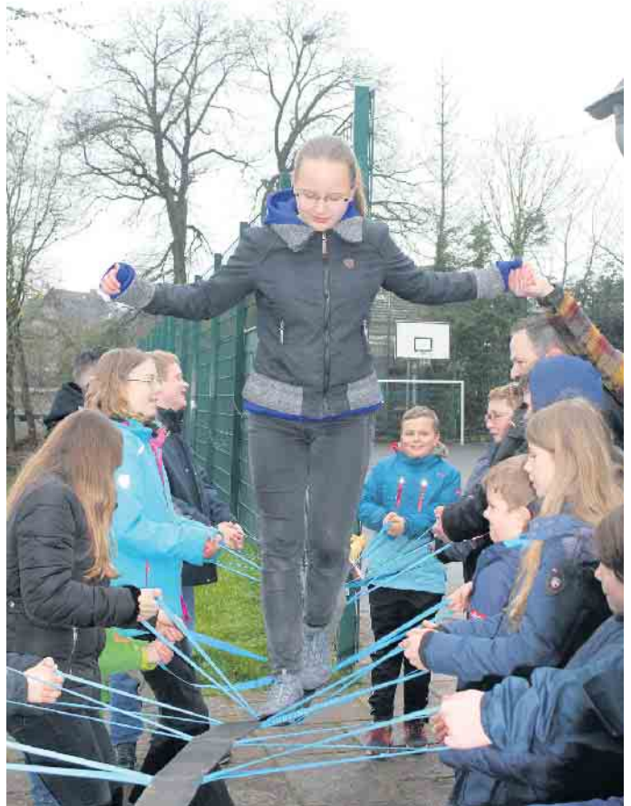
Kooperation und Zusammenarbeit war angesagt