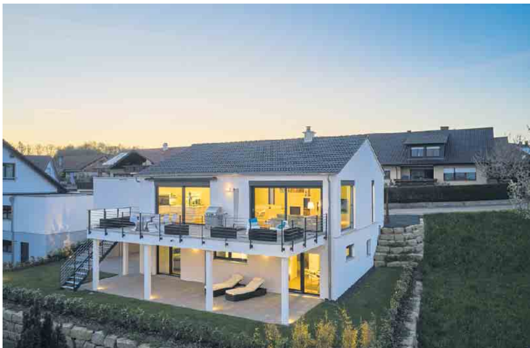
Keller werden heute zum Wohlfühlwohnen genutzt.

Die Kosten für ein unterkellertes Haus liegen ungefähr 20 Prozent höher als bei einem Haus ohne Keller. Die Wohnfläche vergrößert sich jedoch um beachtliche 40 Prozent. Je nach Topografie und Straßenführung kann der Keller mit ebenerdiger Anbindung zum hangseitigen Garten des Grundstücks ausgestattet sein. In einer Souterrainwohnung kann hier durch große Fenster und Türen reichlich Sonnenlicht ins Innere des Wohnbereichs strömen und eine barrierefreie Terrasse leicht zugänglich positioniert werden. Eine Alternative hierzu ist ein sogenannter Lichthof, der beispielsweise über eine Rampe barrierefrei erschlossen werden