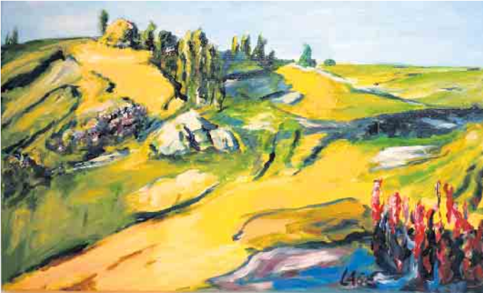
Hof in Karelien.

„Malerische Notizen“ - Kunstausstellung Stefan Lage