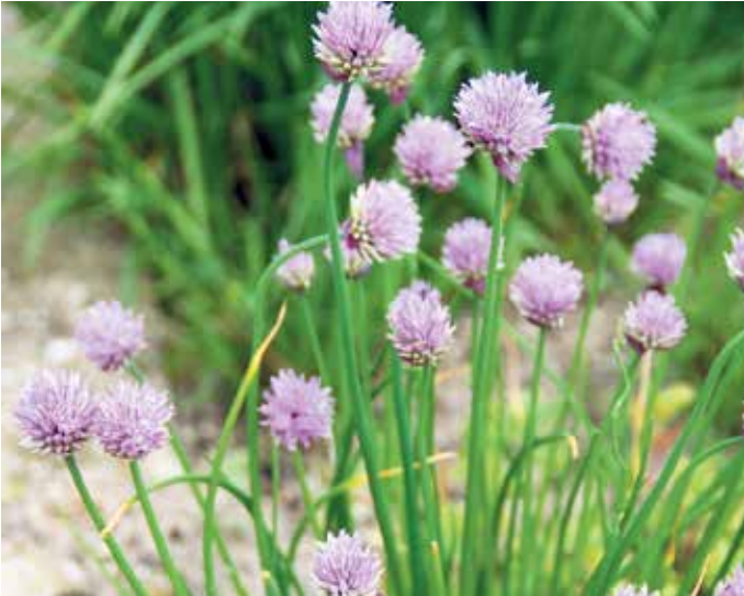
Der Schnittlauch aus dem eigenen Garten ist Schmuck ... und leckere Salatbeigabe.

Wer sich direkt an die Realisierung seiner Wünsche machen möchte, findet auf https://www.mein-traumgarten.de/ eine Liste mit Fachbetrieben des Garten- und Landschaftsbaus in der Nähe. BGL