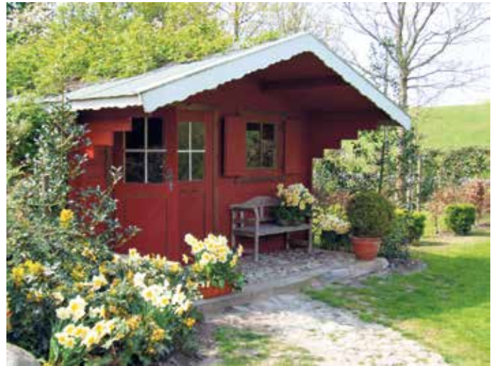
Wir genießen die stärkere Sonneneinstrahlung im Frühling und freuen uns an Austrieb und Blüte der Pflanzen.

die Menschen im Frühling empfinden. Der Lenz markiert traditionell die Erneuerung in der Natur. Wir genießen die stärkere Sonneneinstrahlung und höhere Temperaturen, freuen uns an Austrieb und Blüte der Pflanzen und das Erwachen vieler Tiere aus dem Win-