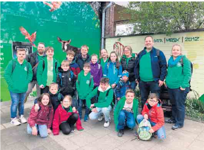
20 Mitglieder der Jugendabteilung machten am 30. März den Kölner Zoo unsicher.

Altendorf in den Kölner Zoo. Die Anreise mit der Bahn verlief ohne Zwischenfälle und im Zoo bega-