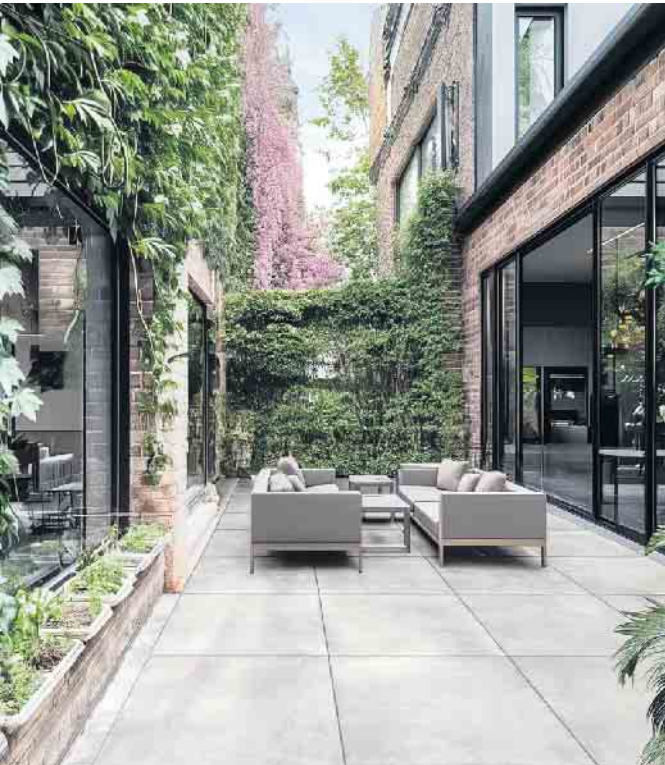
Verleihen dem Außenbereich urbanen Chic: PUREA®-Platten im Format 90x90 cm in Concrete Grey

freie Verlegung und minimieren das Fugenbild - ideal für eine großzügige Terrassengestaltung. Schöne Lösungen für Terrasse und Einfahrt sind zu entdecken im Ideengarten in der Maarstr. 85 in Bonn-Beuel. Mehr Informationen unter www.koll-steine.de . CSH