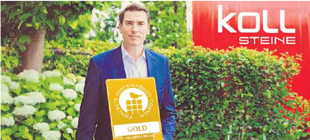
Ausgezeichnet für verantwortungsbewusste Produktion: KOLL Steine erhält Gold-Zertifikat

KOLL Steine setzt Maßstäbe in nachhaltiger Betonsteinherstellung: Das Werk in Bonn wurde mit dem Gold-Zertifikat des Concrete Sustainability Councils (CSC) ausgezeichnet - ein Beleg für verantwortungsbewusste Produktion. Durch den Einsatz von Sekundärmaterialien, erneuerbare Energien wie Solarstrom und gezielte Energieeinsparmaßnahmen senkt das Unternehmen seinen CO 2 -Fußabdruck nachhaltig. Verbleibende Emissionen werden kompensiert - ein wichtiger Schritt Richtung Klimaneutralität.