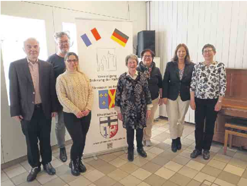
Vorstand der Partnerschaftsvereinigung Villeneuve lez Avignon Rheinbach

Gäste noch in gemütlicher Runde bei einem Glas Rotwein austauschen.