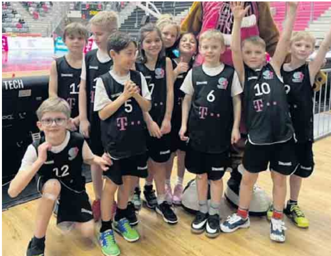
Mit Maskottchen „Bonni“ im Telekom Dome kurz vor dem Finalspiel