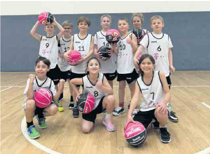
Das zehnköpfige Spielerteam der KGS Meckenheim am Finaltag, 24. Februar, morgens im Ausbildungszentrum der Telekom Baskets

Platz von 36 Schulen zu belegen. Seit nunmehr sechs Jahren begeistert die KGS Meckenheim ihre Schülerinnen und Schüler für die Baskets Grundschul-Challenge und fördert somit die Leidenschaft für den Basketball-Mannschaftssport. Mit ihrer beeindruckenden Leistung hat die Mannschaft erneut gezeigt, welches Potenzial in den jungen Talenten steckt. Die KGS Meckenheim hat bereits angekündigt, auch im nächsten Jahr wieder mit vollem Einsatz an der Challenge teilzunehmen und die Schule würdig zu vertreten.