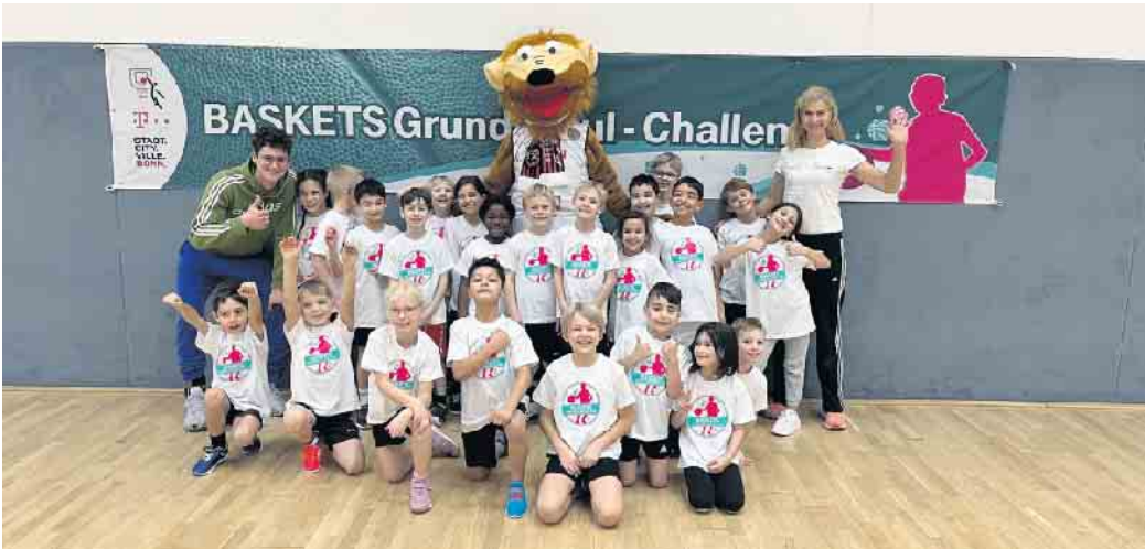
Das komplette Basketball-Team der zweiten Klassen der KGS Meckenheim nach erlangtem ersten Platz der Qualifizierungsrunde der Baskets Grundschul-Challenge im Dezember 2023 im Ausbildungszentrum der Telekom Baskets in Bonn

In einer spannenden Finalrunde der besten acht Basketball-Grundschulteams der ersten und zweiten Klassen aus Bonn und Umgebung im Telekom Dome in Bonn verlor am Samstag, 24. Februar, die Mannschaft der KGS Meckenheim im „kleinen Finale“ nur knapp gegen den Vorjahres-Sieger Schlossbachschule und beendete das Turnier mit einem vierten Platz. In der Qualifizierungsrunde der Baskets Grundschul-Challenge im vergangenen Dezember, die ebenfalls in Bonn stattfand und an der insgesamt 36 Grundschulen aus Bonn und Umgebung teilnahmen, erlangte die KGS Meckenheim mit der Schlossbachschule im Stationenwettbewerb punktgleich Platz 1 und war damit eine der acht verbleibenden Schulen, die sich für diese Finalrunde qualifiziert hatten. Seit Dezember stand daraufhin alles im Zeichen des Trainings und damit der Vorbereitungen auf diesen großen Finaltag: Passen, Dribbeln, Korbleger üben, Positionswurf, Angriff-Verteidigung trainieren. Die Motivation war hoch, die Freude und der Spaß am Basketballspiel sowieso. Und mit jedem Tag stieg die Vorfreude auf den großen Finaltag! Bereits die Vorstellung, am Finaltag wie die großen Basketball-Stars im Telekom Dome einzulau-