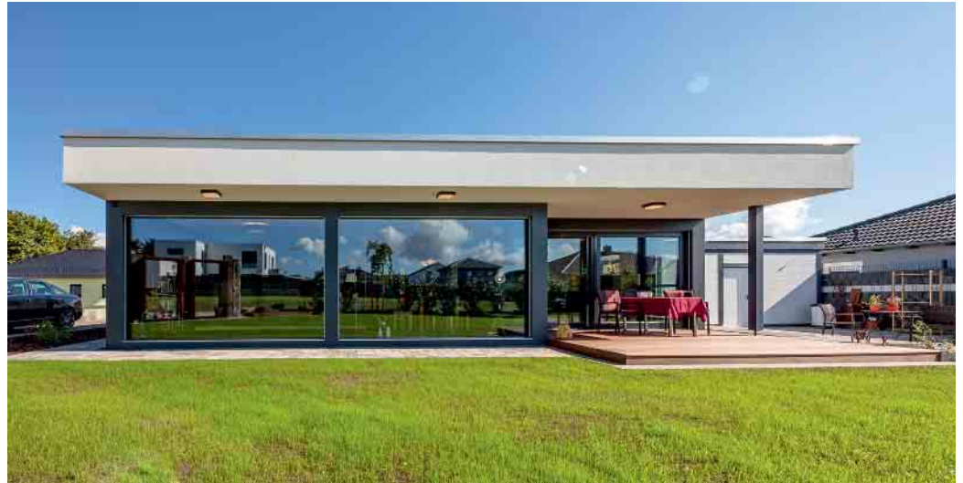
Bauherren schätzen den Komfort eines Bungalows in Holz-Fertigbauweise.

Das entscheidende Merkmal des Bungalows ist, dass er nur eine Etage hat. Schlafzimmer, Wellnessbad und Wohnbereich befinden sich allesamt im Erdgeschoss. Auch für ein Gästezimmer, ein Homeoffice und natürlich die Haustechnik findet sich in modernen Bungalow-Grundrissen Platz. Lästiges Treppensteinen entfällt entweder ganz oder lässt sich wahlweise auf ein Minimum reduzieren, wenn der Bungalow beispielsweise um