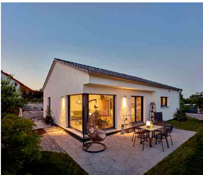
Nicht nur, aber besonders bei älteren Menschen ist das Wohnen auf einer Ebene beliebt.

„Die meisten Bauherren – ob jung oder alt – schätzen Komfort und lieben es, ihre besten Jahre in schöner Umgebung zu genießen“, sagt der BDF-Sprecher. Sie entscheiden sich für pflegeleichte, hochwertige Ausstattung und Einrichtung sowie für technische, auch automatisierte Features, um Wohnkomfort und erhöhte Sicherheit zu genießen. „So ziemlich alles lässt sich mit einem modernen Fertighaus individuell auf die Wünsche und Bedürfnisse des Bauherrn anpassen und planungssicher in die Tat umsetzen“, schließt Tews. (BDF/FT)