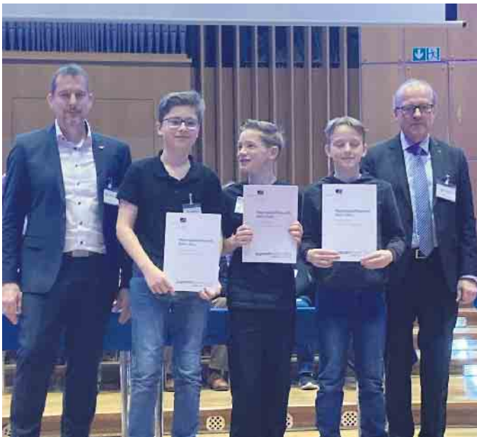
Erster Preis bei Jugend forscht.

25 Schüler*innen des Städtischen Gymnasium Rheinbach gewinnen erste und zweite Preise sowie Sonderpreise bei „Jugend forscht“