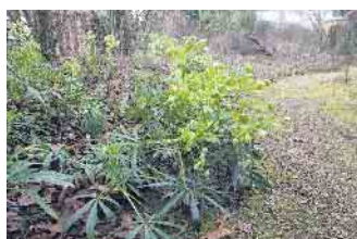
Erste Blüten im Naturnahen Garten: Die Stinkende Nieswurz