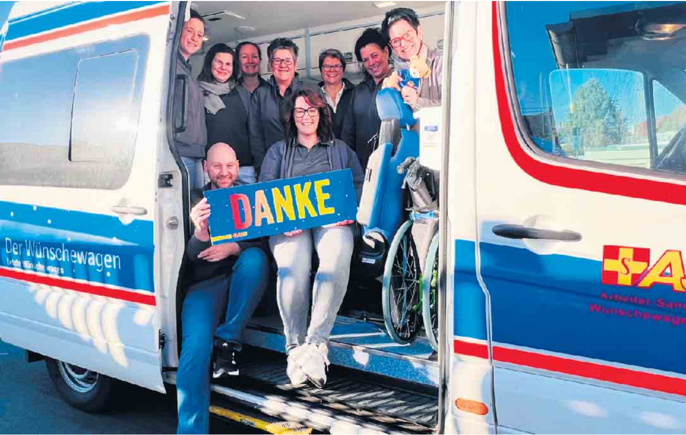
Stellvertretend für das ganze Team der Praxis für Physiotherapie Ohlerth und Steinbrüggen danken Mitarbeitende allen Spenderinnen und Spendern, die den Erfolg ihrer Aktion „Wünsche statt Schokolade“ möglich gemacht haben.

Fortsetzung der Titelseite Und das kam gut an. Weit über 700 Euro waren zusammengekommen, die vom Team selbst aus eigener Tasche noch auf den vierstelligen Betrag aufgerundet wurden. Im Namen von Wunschewagen, einem ehrenamtlichen Projekt des Arbeiter-Samariter-Bundes (ASB), dankte die Koordinatorin für die Region Rheinland dem Praxisteam für die großartige Unterstützung. Nur durch Spenden,