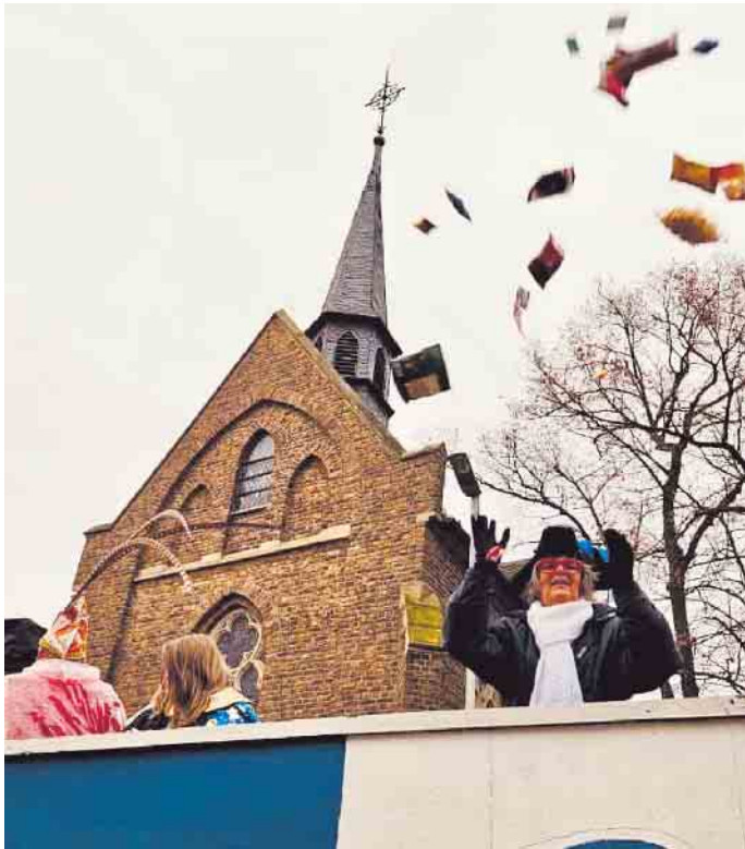
Es regnet Kamelle am Merler Dom