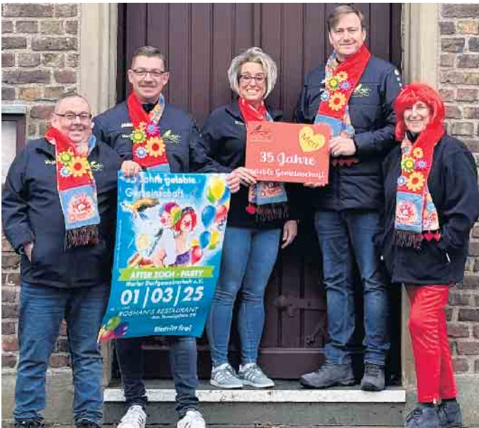
Die Karnevalsfreunde der Merler Dorfgemeinschaft freuen sich auf viele fröhliche Gesichter und eine großartige Stimmung.