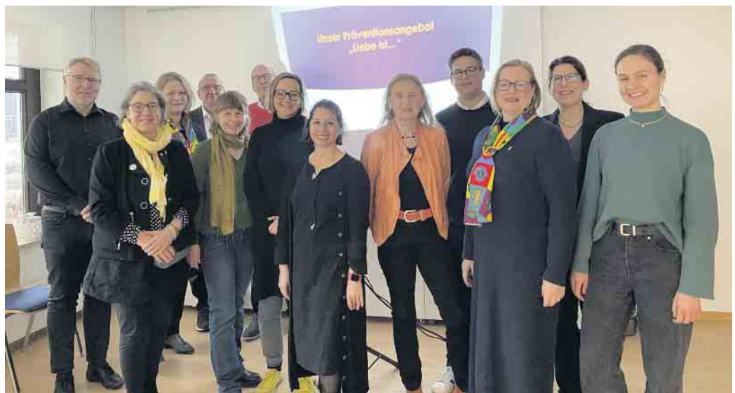
Das Team des Frauenzentrums und Mitglieder des Lions Club Rhein-Sieg

Dazu bieten wir im Oktober 2025 ein „Train the Trainer“-Seminar an, in dem Multiplikatorinnen und Multiplikatoren ausgebildet werden, um eigenständig Präventionsworkshops durchzuführen. Wir danken allen Beteiligten, die unser Präventionsprojekt unterstützen und freuen uns, gemeinsam ein Zeichen gegen Gewalt zu setzen. Für alle Mädchen ab 14 Jahren bieten wir Beratungen an - auch telefonisch und per Chat. Weitere Informationen zu unseren Angeboten sind auf unserer Webseite zu finden.