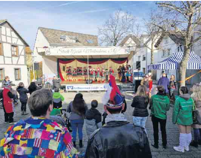
Jeckentreff auf dem Merler Dorfplatz 2024

jebirch“ (Many Lohmer), sowie die Band „Gate 5“ für eine ausgelassene Stimmung. Von 11 bis 15 Uhr kann gefeiert werden, bis anschließend der Merler Zug durch die Straßen zieht.