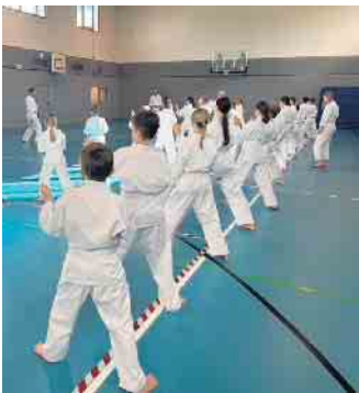
KiDo Kampfspieletag Okt 2024

KiDo: vfg-meckenheim.de/goto//kido Sport-Karate: vfg-meckenheim.de/goto//msk