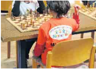
Teilnehmerin der Siegermannschaft im Spiel vertieft.

die Schachbretter und die Schachuhren stellte. Die weiterführenden Schulen treffen sich Anfang Februar zur Kreismeisterschaft an der CJD Königswinter. Die Platzierungen sind: 1. Platz: GGS Sürster Weg Rheinbach 2. Platz: Wendelinus-Schule Bornheim 3. Platz: KGS Pingsdorf (Rhein-Erft-Kreis) 4. Janosch Grundschule Troisdorf 5. Wendelinus-Schule Bornheim 6. KGS Merzbach Rheinbach 7. GGS Witterschlick Alfter 8. KGS Merzbach Rheinbach 9. GGS Witterschlick Alfter 10. GGS Witterschlick Alfter