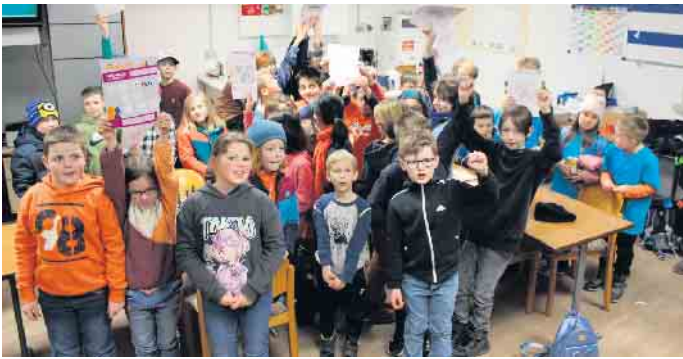
Alle teilnehmenden Grundschülerinnen und Grundschüler sind Sieger