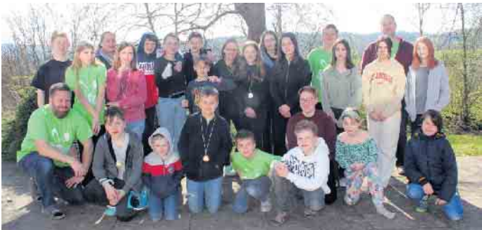
Auch im vergangenen Jahr hatten die Teilnehmerinnen und Teilnehmer bei der Osterfreizeit viel Spaß.

bruderschaft Ersdorf-Altendorf bietet seit mehreren Jahren offene Angebote für Kinder- und Jugendliche an.