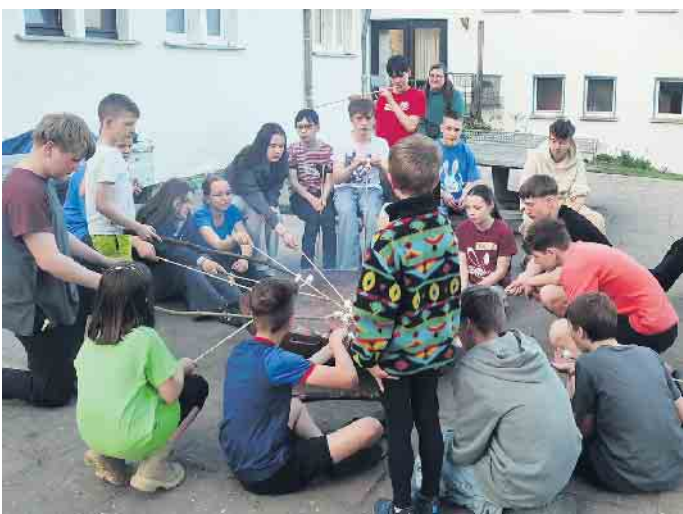
Osterfreizeit 2025: Marshmallows an der Feuerschale

Die Schützenjugend Ersdorf-Altendorf richtet die Osterfreizeit mit ihren ausgebildeten Jugendleiterinnen und Leitern bereits zum 5. Mal aus. Die Plätze sind begrenzt und werden nach Anmeldeeingang vergeben. Ausschreibung und Anmeldeformular gibt es unter https://altendorf-ersdorf.info/wp-content/uploads/2026/01/Anmeldung-Osterfreizeit.pdf .