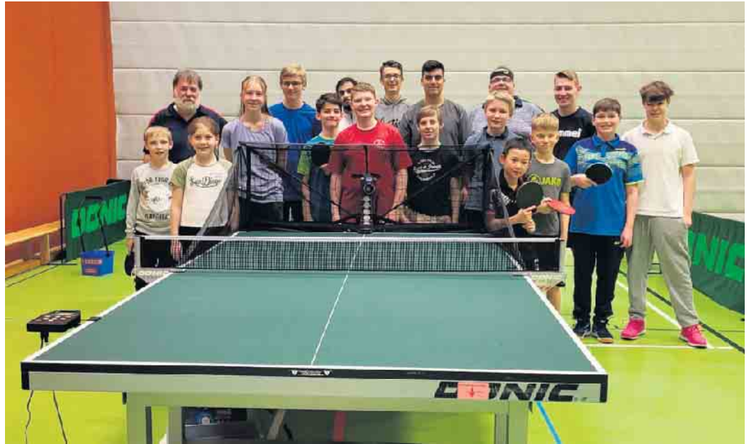
Die Tischtennis Jugendgruppe mit ihrer neuen Ballmaschine

Meckenheimer Sportverein eng zusammenarbeitet, setzte noch eins drauf. Zwei Kisten mit je 120 hochwertigen Bällen im Wert von über 100 Euro wurden großzügig zur Verfügung gestellt. Damit erhielt die Tischtennisabteilung nicht nur die ersehnte Ballmaschine (DONIC Robopong Newgy 2055) samt Transporttasche, sondern auch 240 hochwertige DONIC Trainingsbälle.