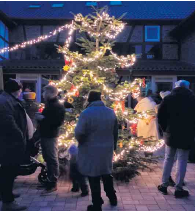
Ein Einblick in das Lichterfest!