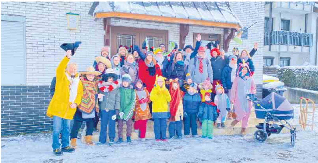
Die Karnevalisten sammelten im letzten Jahr auch im Schnee

Die 1. Karnevalsgemeinschaft Merl 2000 e.V. gibt bekannt, dass sie wieder mit der Sammelbüchse loszieht, um für den Karnevalszug in Merl am Karnevalssamstag, 10. Februar , zu „kötten“. Der 1. Köttzug startet am 13. Januar um 11.11 Uhr und führt durch den Steinbüchel. Eine Woche später, am 20. Januar, ziehen die Karnevalisten durch das Wohngebiet „Auf dem Rott“ und durch den „Merler Winkel“. Der letzte Köttzug, am 27. Januar, geht durch den Merler Ring und durch Alt Merl. Die 1. Karnevalsgemeinschaft Merl ruft insbesondere die Gruppen, die sich für den Zug in Merl am 10. Februar angemeldet haben (Anmeldeformulare findet man unter www.kg-merl.de , Downloads) zur Teilnahme an den Köttzügen auf, da diese mit einem Kamellenanteil „entlohnt“ werden. Treffpunkt für alle Köttzüge ist