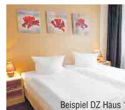
Beispiel DZ Haus 1