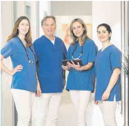
Das Team der dental suite im Kölner Rheinauhafen

Gerade im Vergleich zu einem vollständigen Zahnersatz mit Implantaten ist das All-on-4® Konzept eine vergleichsweise kostengünstige Behandlungsoption. Darüber hinaus kommt die Methode auch Angstpatienten sehr entgegen, da der gesamte Behandlungszeitraum (inklusive Vorbereitung und Nachbehandlung) sehr kurz gehalten werden kann.