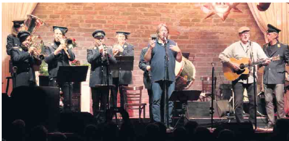
Die „Bloskappell“ spielte, zur Verwunderung von Fuhrmann und Kulik, Töne, die es noch nicht gibt

Karten sind erhältlich über: www.koelnerkartenladen.de oder über die Tickethotline: 02203 599480