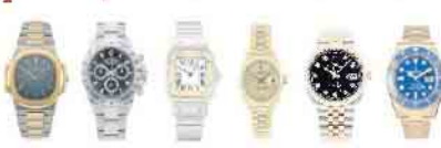
Ankauf von Uhren aller Art - Wir zahlen bis zu 100.000,00 €