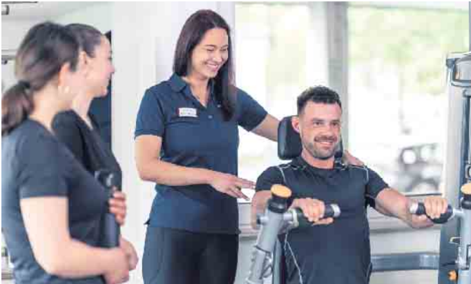
Ausbildungen und Studiengänge im Fitness- und Gesundheitsbereich eröffnen zahlreiche berufliche Möglichkeiten.

Dieser Wert entspricht einem Zuwachs von über einer Million Mitgliedern im Vergleich zum Vorjahr, wie die „Eckdaten der deutschen Fitnesswirtschaft 2024“ zeigen - eine Datenerhebung des DSSV, der Prüfungs- und Beratungsgesellschaft Deloitte sowie der DHfPG. Schon 2022 hatte es ein Plus von einer Million Mitgliedern gegeben - was allerdings noch zu einem Großteil auf den Nachholeffekt nach der Aufhebung der pandemiebedingten Beschränkungen zurückgeführt werden konnte. 2023 hat sich der Wachstumstrend in gleicher Größenordnung fortgesetzt. (DJD)