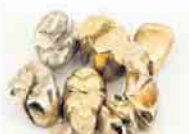
Zahngold - auch mit Zahn