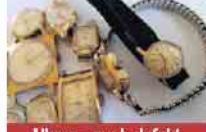
Uhren - auch defekt