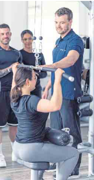
Gut ausgebildete Fachkräfte betreuen Kundinnen und Kunden in Fitness- und Gesundheitsanlagen bei ihrem bedarfsgerechten Training.

Dieser Wert entspricht einem Zuwachs von über einer Million Mitgliedern im Vergleich zum Vorjahr, wie die „Eckdaten der deutschen Fitnesswirtschaft 2024“ zeigen - eine Datenerhebung des DSSV, der Prüfungs- und Beratungsgesellschaft Deloitte sowie der DHfPG. Schon 2022 hatte es ein Plus von einer Million Mitgliedern gegeben - was allerdings noch zu einem Großteil auf den Nachholeffekt nach der Aufhebung der pandemiebedingten Beschränkungen zurückgeführt werden konnte. 2023 hat sich der Wachstumstrend in gleicher Größenordnung fortgesetzt. (DJD)