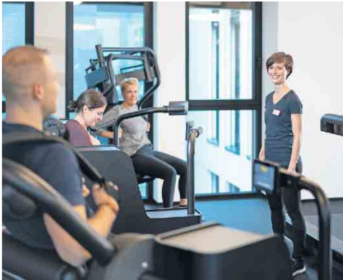
Fitness- und Gesundheitsanlagen etablieren sich zunehmend als elementare Bestandteile der Gesundheitsversorgung. Entsprechend gut muss die Ausbildung der Fachkräfte sein.

Branche - wer sich entsprechend qualifiziert, hat ausgezeichnete berufliche Perspektiven. Optionen zum Studium und zur Weiterbildung im Bereich Fitness- und Gesundheitstraining Denn den Fachkräften -