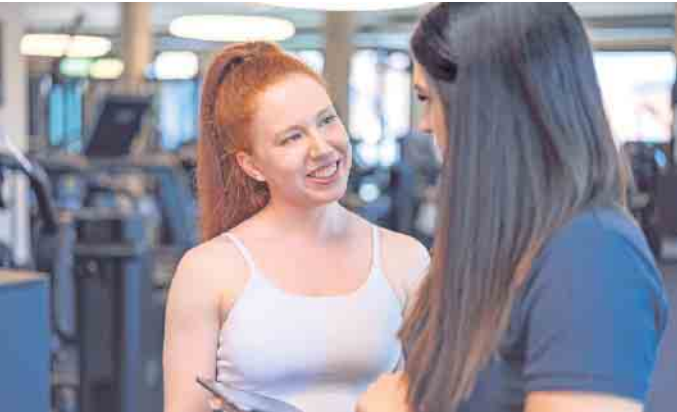
Fitness- und Gesundheitsanlagen sind in allen Altersgruppen gleichermaßen beliebt.