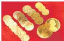
Goldmünzen aller Art