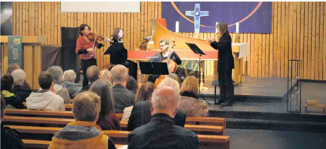
Das „Ensemble Rossi“ spielte in der Markuskirche jüngst Musik des Frühbarock.

Reihe der Kirchenkonzerte der evangelischen Kirchengemeinde präsentierte jüngst Barockmusik - im Dezember folgt letztes Konzert