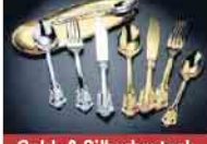
Gold- & Silberbesteck

Wir zahlen JETZT bis zu 85 € pro Gramm Gold