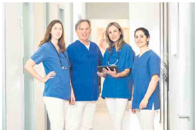
Das Team der dental suite im Kölner Rheinauhafen

Gerade im Vergleich zu einem vollständigen Zahnersatz mit Implantaten ist das All-on-4® Konzept eine vergleichsweise kostengünstige Behandlungsoption. Darüber hinaus kommt die Methode auch Angstpatienten sehr entgegen, da der gesamte Behandlungszeitraum (inklusive Vor-