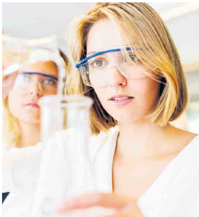
Ausbildungsberufe in der pharmazeutischen Produktion sind oft weniger bekannt, bieten aber gute Perspektiven.

Der Clou dabei: Die Jugendlichen beginnen das Programm, ohne zu wissen, welcher Ausbildungsberuf dabei herauskommt. So können sie sich ausprobieren und herausfinden, was ihnen liegt: eher das technische oder elektrotechnische Umfeld, das Handwerk, die Me-