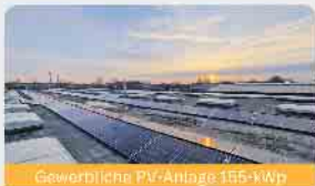
Gewerbliche PV-Anlage 155-kWp