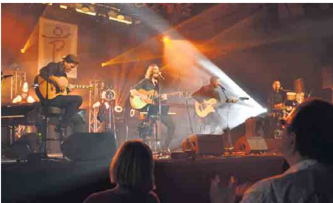
Das Festival ist seit ein paar Jahren zu Gast in Porz-Mitte: 2021 trat unter anderem die Band Band Pectus im Rathausaal auf.