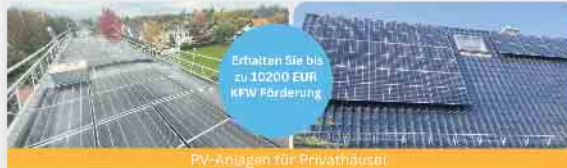
PV-Anlagen für Privathäuser