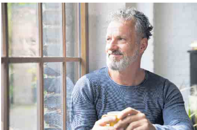
Kleine Rituale wie die morgendliche Tasse Tee am Küchenfenster sorgen für Momente der Entschleunigung.

Ob wir eine Aufgabe als negativen Stress oder positive Herausforderung empfinden, hängt auch von der Bewertung ab. Oft hilft