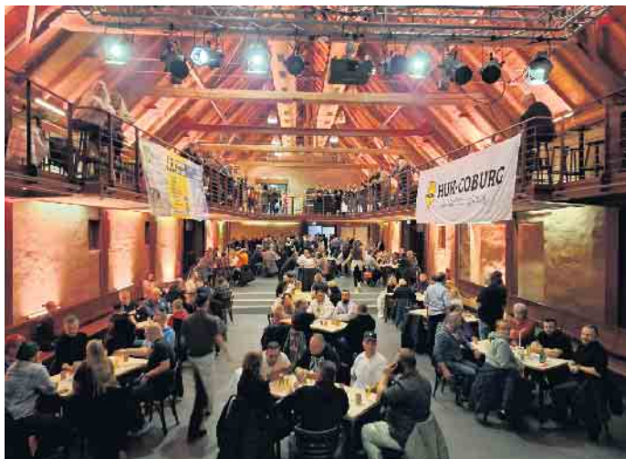
Super Stimmung im großen Saal des Eltzhofs wird es auch in diesem Jahr geben.

dass es nicht nur Pokale und hochwertige Sachpreise für die Podiumsplätze gibt, sondern, dass jede(r) Teilnehmer(in) einen Preis mit nach Hause nehmen wird. Co-Organisator Dirk Breuer bedankt sich bei allen Partnern und freut sich darauf, auch in diesem Jahr „wieder einen super Abend mit Freunden“ zu erleben. „Schocken verbindet, die Stimmung ist immer klasse und wird in diesem Jahr durch DJ emkay so richtig angeheizt“, ergänzt der umtriebige Organisator Rule Mews. Aufgrund der Nähe zur bevorstehenden Karnevals-Session sind Kostüme gerne gesehen. Anmeldungen sind auch vor Ort möglich, sollten aber besser vorab per WhatsApp unter 0157 7146 2376 oder per E-Mail an kontakt@mbrm.de erfolgen, um so eine Mitspielgarantie zu haben. Start ist am Freitag, 7. November, um 19 Uhr, Einlass ab 17:30 Uhr. Weitere Infos bei instagram unter porz_schockmeisterschaft .