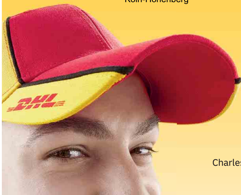
Charles, einer von uns.