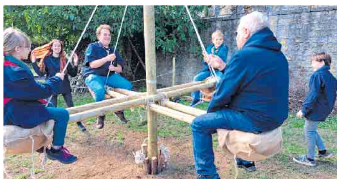
Das Karussell lockte Jung und Alt, egal ob aus Köln oder Luxemburg