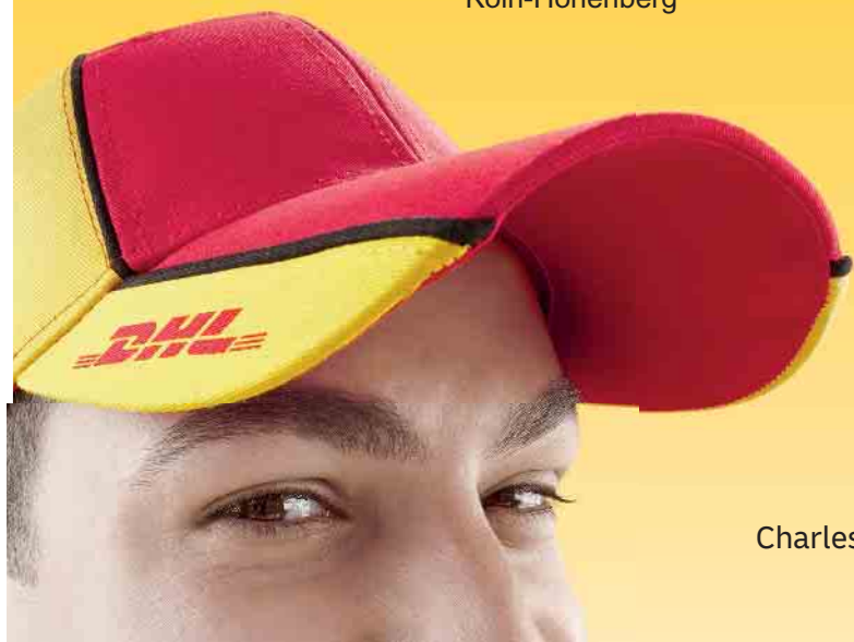
Charles, einer von uns.