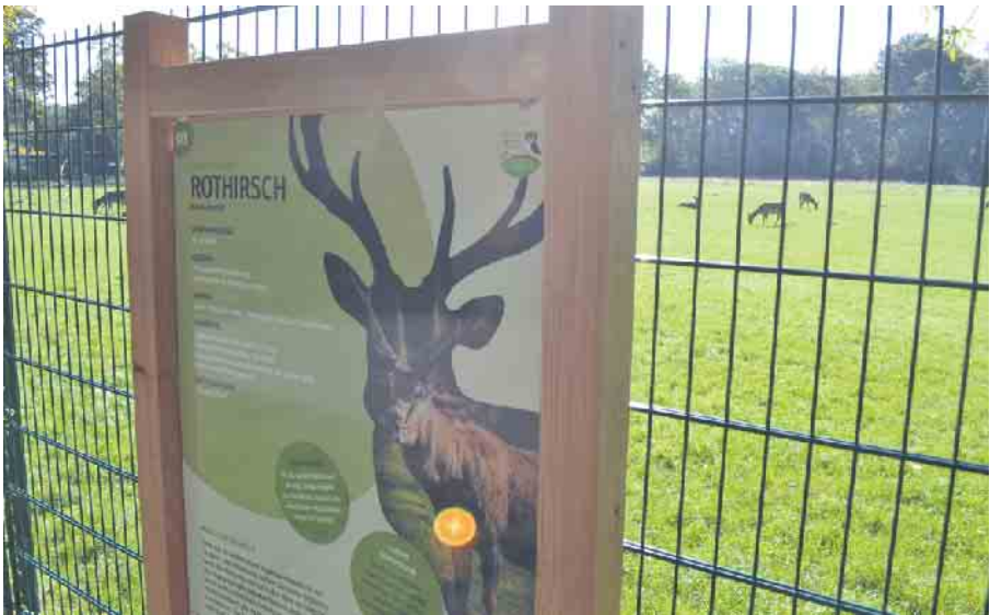
Die Tafel am Zaun, die beschrieben Tiere gleich dahinter.