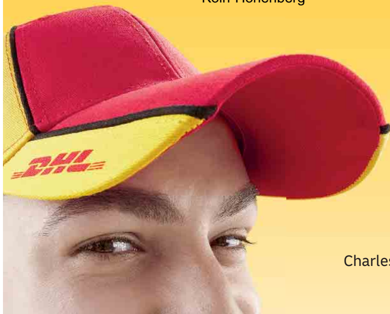
Charles, einer von uns.