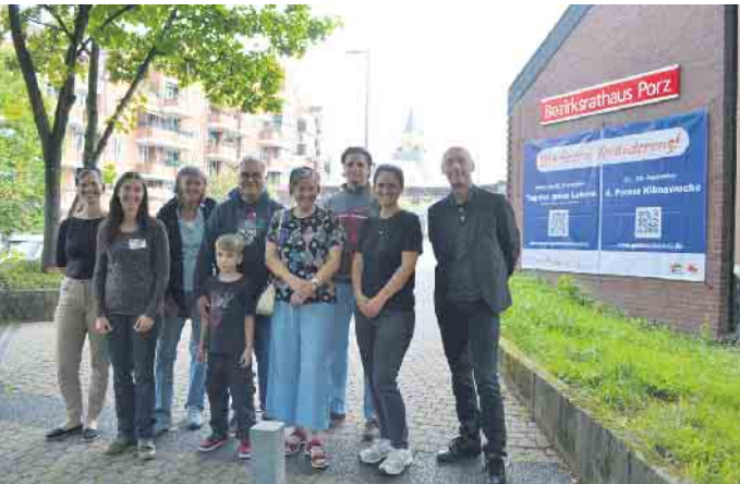
Am 20. September findet der „Tag des guten Lebens“ statt.

„Tag des guten Lebens“ findet am Samstag, 20. September, in Porz-Mitte statt - Akteure von Festausschuss Porzer Karneval bis Klimatreff sind dabei