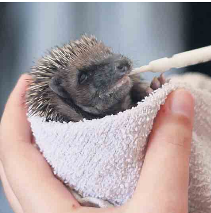
In der Igel-Auffangstation werden die Tiere behandelt und gepflegt.