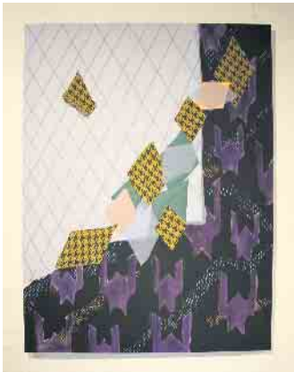
Eine der Arbeiten von Sarah Kirschnick.