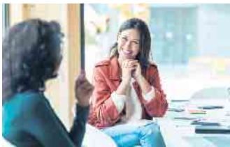
Ein Bewerbungsgespräch ist immer ein Dialog, bei dem auch der Ar-beitgeber auf dem Prüfstand steht.

Ein Grund für erfolglose Bewer-bungsversuche ist häufig, dass Menschen ihre eigenen Stärken nicht kennen. Es ist deshalb wich-tig, Folgendes zu hinterfragen: Worin bin ich wirklich gut? Wel-che positiven Faktoren bringe ich