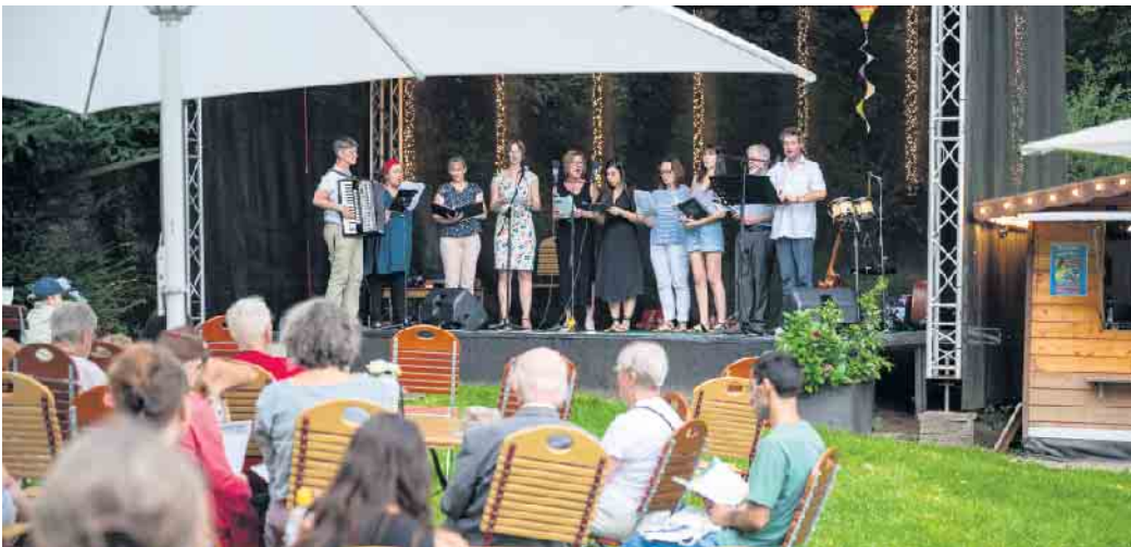
Die Sängerinnen und Sänger des „Qhor“ beim Mitsingkonzert im vergangenen Jahr.

Der Chor der Mitarbeiterinnen und Mitarbeiter des Gesundheitscampus Quirlsberg lädt alle Menschen in Bergisch Gladbach und Umgebung zu einem Mitsingkonzert. Am Samstag, 6. September, um 16 Uhr erklingen im Gemeindegeminschaftssaal Engel am Dom (Hauptstraße 258, 51465 Bergisch Gladbach) bekannte Lieder, die jeder mitsingen oder zumindest mitsummen kann. Liederhefte werden vor Ort ausgeteilt und sind gleichzeitig digital zum Mitlesen auf dem Handy verfügbar. Der Eintritt ist frei. Die Sängerinnen und Sänger freuen sich über eine Spende für den Förderverein des Evangelischen Krankenhauses Bergisch Gladbach. Vor Ort können Getränke