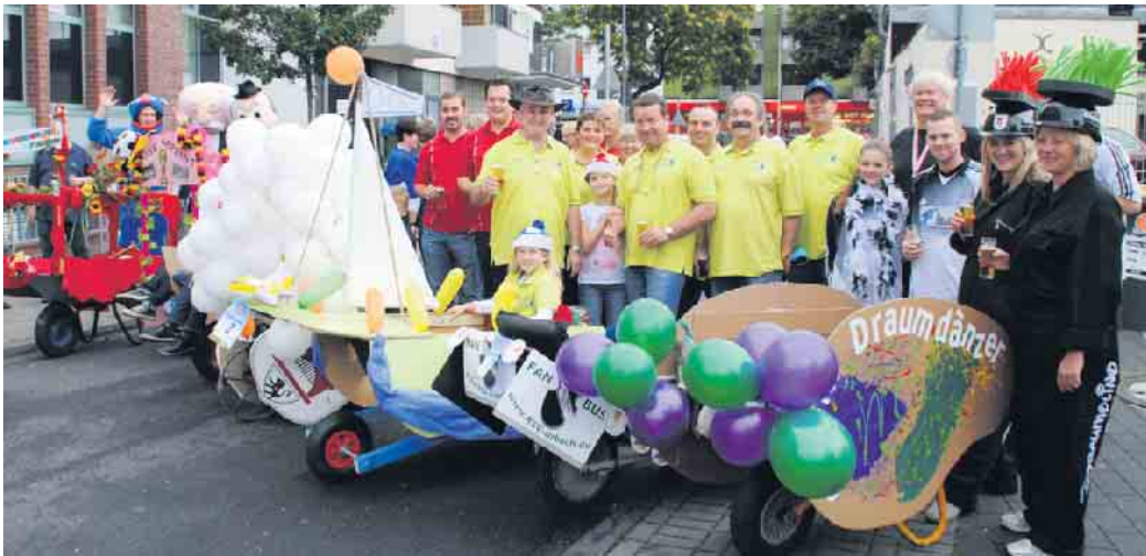
Mannschaften im Schürreskarrenrennen in der Kupfergasse 2019