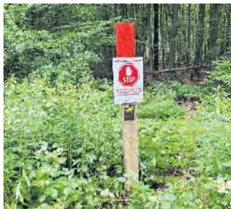
Wo Menschen nichts verloren haben, zeigen Schilder in der Wahner Heide eindeutig an.