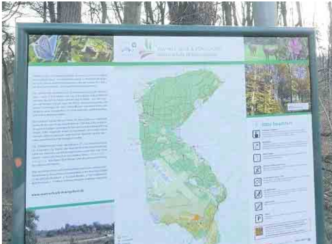
Reichlich beschilderte Wanderwege bietet das Naturschutzgebiet Wahner Heide und der angrenzende Königsfort.