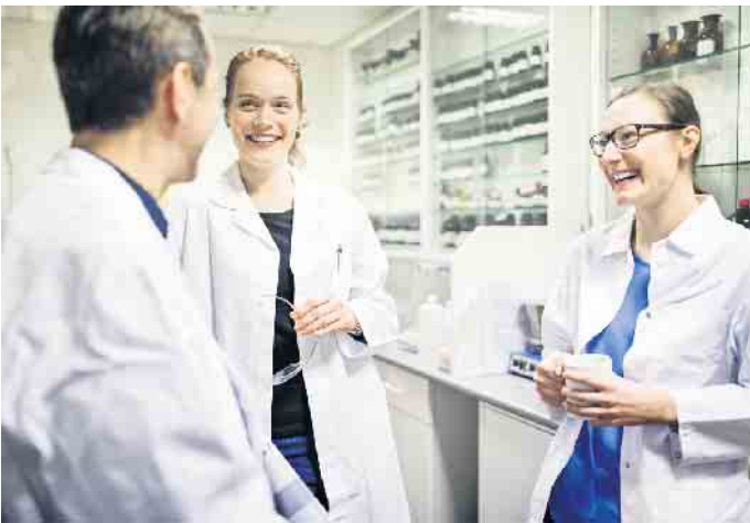
Teamarbeit und abwechslungsreiche Aufgaben machen den Beruf des pharmazeutisch-technischen Assistenten so interessant.

Die Ausbildung als PTA bietet viele Möglichkeiten und Abwechslung