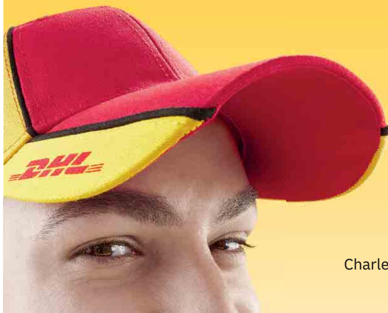
Charles, einer von uns.