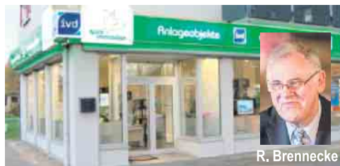
Im Zentrum von Porz: Goethestraße / Ecke Bahnhofstraße

Rathausaal Porz Veranstaltungen im Bezirksrathaus Porz