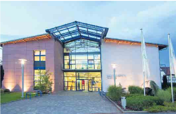
Das Bundesausbildungszentrum der Bestatter.

Bestatter fühlen sich als Experten im Umgang mit dem Tod dem deutschen Handwerk besonders verbunden. Um die hohe Qualität der Ausbildung zu gewährleisten, fordert der Bundesverband Deutscher Bestatter e.V. (BDB) daher Mindeststandards beim Zugang zum Bestatterberuf ( www.bestatter.de ).