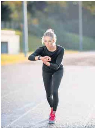
Immer mehr Menschen halten sich mit Sport fit und nutzen dabei auch sogenannte Wearables wie eine Fitnessuhr.

Neben den Leistungen des zweiten Gesundheitsmarktes haben auch digitale Dienste und Apps für das individuelle Training sowie Wearables immer mehr an Bedeutung gewonnen. Ausgaben für Aktivitäten in den Bereichen Sport, Fitness und Gesundheit werden bereits von vielen Krankenkassen erstattet. Der interdisziplinäre Studiengang Bachelor-of-Science Sport-/Gesundheitsinformatik etwa qualifiziert die Absolventinnen und Absolventen, digitale Trainings-, Assistenz- und Datenverarbeitungssysteme speziell für die Sport-, Fitness- und Gesundheitsbranche zu entwickeln. (djd)