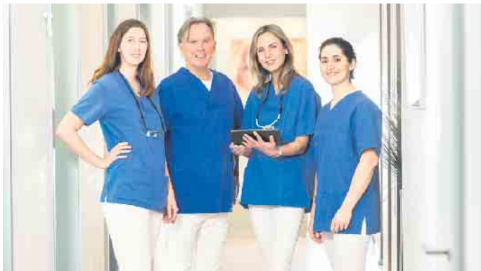
Das Team der dental suite im Kölner Rheinauhafen

Vorteile gegenüber Prothesen Herausnehmbarer Zahnersatz stört nicht selten beim Sprechen und auch die Angst vor dem Versagen der Haftcreme bleibt immer im Hinterkopf präsent. All-on-4® Zahnersatz ist hingegen fest im Kiefer verankert. Dem-