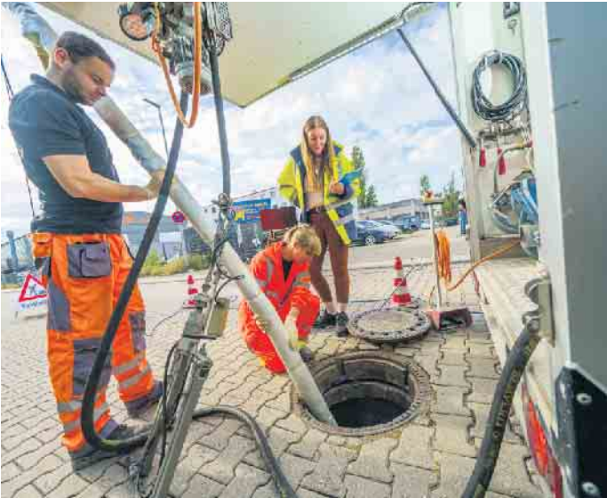
Der Einsatz der Kanaltechnik erfordert umfassende Fachkenntnisse, die während der dreijährigen Berufsausbildung vermittelt werden.

Industrieanlagen gefragte Spezialisten mit sicheren Berufsaussichten. Zudem können sie sich fortlaufend weiterbilden und somit ihren persönlichen Karriereweg beschreiten - beispielsweise als zertifizierter Kanalsanierungsberater, Meister, Techniker oder auch als Ingenieur.