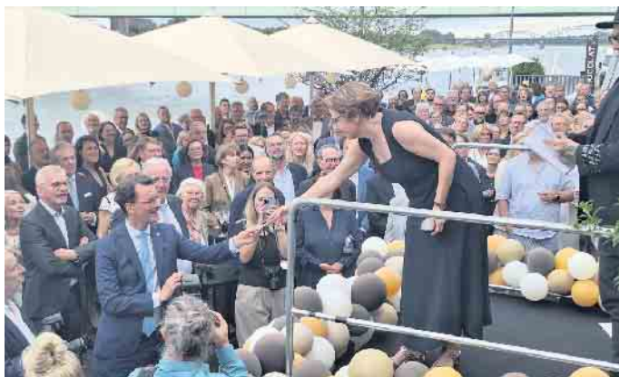
Anette Imhoff übergibt Ministerpräsidenten Hendrik Wüst eine symbolische Eintrittskarte zur neuen Ausstellung

Das Schokoladenmuseum Köln verbindet Geschichte mit Gegenwart, Genuss mit Verantwortung, Emotion mit Information - und lädt kleine wie große Gäste ein, Schokolade neu zu entdecken: „Kommt vorbei und erlebt die Magie des Kakaos - im Schokoladenmuseum Köln“ - weitere Informationen erhalten Sie vor Ort und online unter www.schokoladenmuseum.de