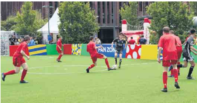
Gespielt wurde im Soccer-Court der Football Experience zur UEFA EURO 2024 in Deutz.