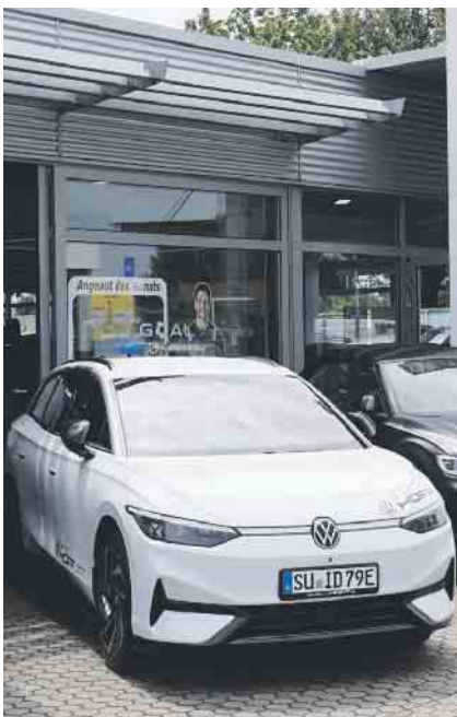
Das VW-Sondermodell GOAL