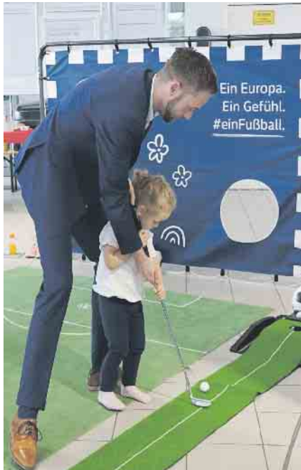
Gemeinsamer Golfschlag von Groß und Klein