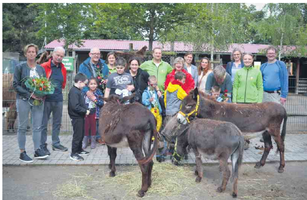
Pädagogen, das Team vom Streichelzoo, Vertreter*innen der Stiftung Wunschkpunkte für Kinder und reichlich Tiere bei der Spendenübergabe.

Das Angebot selbst wird über Spenden und den Förderverein finanziert. So hat jüngst die Langer Stiftung Wunschkpunkte für Kinder Geld zur Fortführung bereitgestellt.