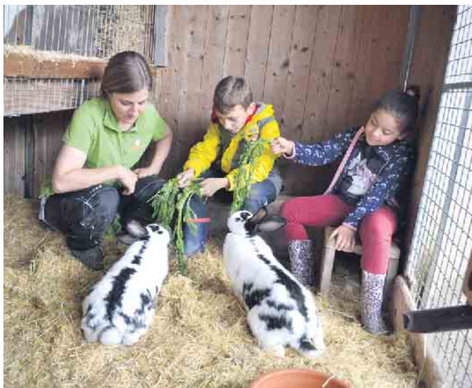
Füttern, Streicheln und verantwortungsvollen Umgang mit Tieren lernen die Kinder der Förderschule.

Hier warten dann etwa Schwein Schnitzel oder die Esel Knut und Samer auf die Kinder. „Wir sind ein gemeinnütziger Verein. Ein Gnadenhof“, erklärt Holger Peters. Das Angebot stehe so auch anderen Einrichtungen offen. Zudem fährt Peters auch regelmäßig mit Tieren in Senioreneinrichtungen. (Lars Göllnitz - der Autor bei Instagram: @enqoozee)