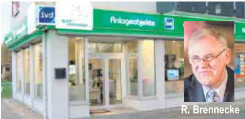
Im Zentrum von Porz: Goethestraße / Ecke Bahnstraße