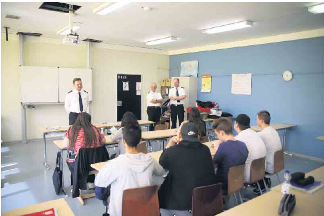
Die Schüler*innen konnten jede Woche viel Neues aus dem Bereich der Feuerwehr mitnehmen.

finde es gut, dass wir jetzt auch unseren Mitschüler*innen helfen können, wenn sie sich verletzt haben“, berichtet ein Schüler. Und auch für die gesamte Feuerwehr Köln war das Projekt ein Erfolg. „Wir versuchen seit Jahren, Nachwuchs zu gewinnen. Da ist eine solche AG, wie sie hier angeboten wurde, genau richtig. Wir müssen heute hin zu denen, die wir als Mitglieder gewinnen