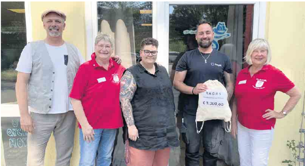
Spendenvermittler, Spender und Empfänger freuen sich für die unterstützten Kinder.

Der Bürgerverein Porz-Mitte hat eine Spende für die Übermittagsbetreuung des Jugendzentrums OT Arche Nova vermittelt