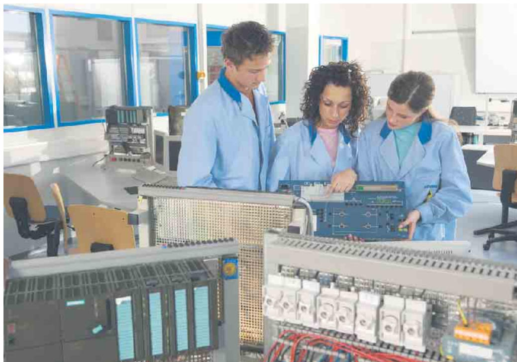
Während eines Praktikums gewinnt man Einblicke ins Berufsleben.