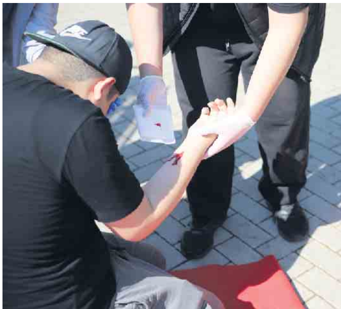
Auch Erste Hilfe stand regelmäßig auf dem Stundenplan.