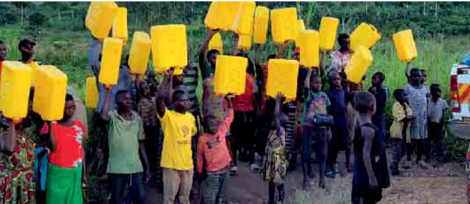
Mit den mitgebrachten Jerry Cans kann Wasser transportiert werden.