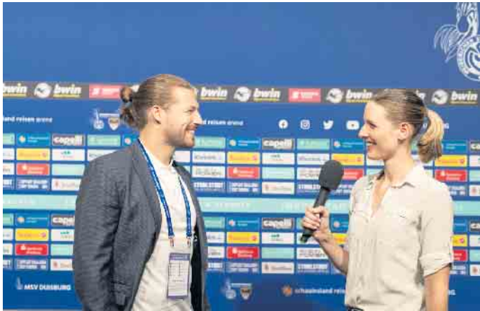
Reporter und Journalisten sind ganz nah dran an den wichtigen Leuten des Sportbusiness. Hier ist die richtige Kommunikation ausschlaggebend.

Die Sportkommunikation gehört zu den spannendsten Berufsfeldern des Sportbusiness. Viele junge Menschen wollen nah am Spielgeschehen sein und Reporter, Kommentator, Social-Media-Experte oder Videojournalist im Fußball werden. Allerdings: Nur wer das Geflecht aus Sport, Medien und Wirtschaft durchschaut, kann durch gelungene Kommunikation über die geeigneten Kanäle Positives für sich, seinen Verein, seinen Verband oder seine Marke erreichen. Das IST-Studieninstitut bietet jetzt eine neue Weiterbildung an, in der sich Interessenten berufsbegleitend zum Kommunikationsprofi weiterbilden können.