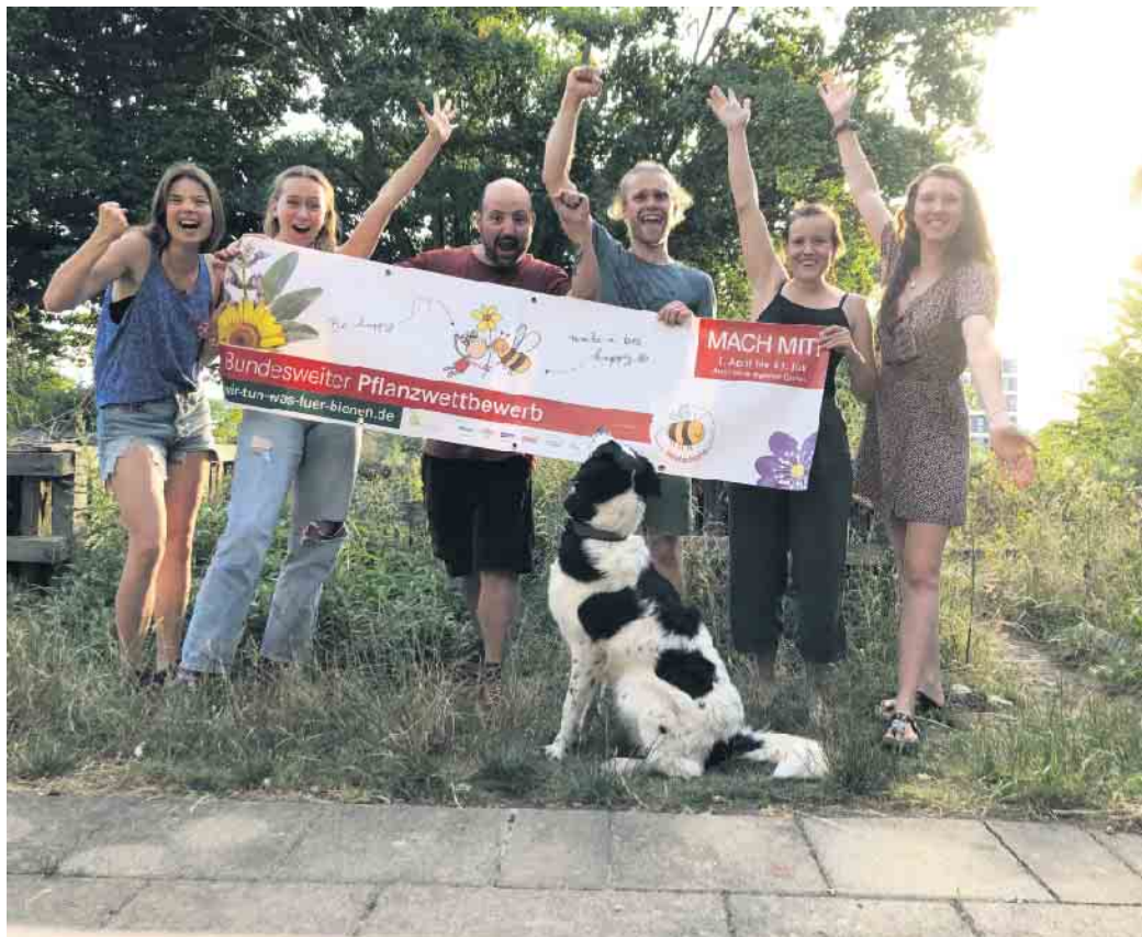
Ehemalige Gewinner*innen beim Deutschland summt!-Pflanzwettbewerb 2022.

Wie wäre es, wenn Sie Ihren Garten, den Balkon, die Terrasse oder eine andere Fläche in eine Insektenoase verwandeln? Egal wie alt Sie sind und wie groß die Fläche ist, Sie können mitmachen! Gegärtet wird deutschlandweit in zehn Kategorien. Als Teilnehmer*in dokumentieren Sie Ihre Pflanzaktion mit Text und Vorher-Nachher-Fotos. Die Dateien laden Sie dann bis zum 31. Juli auf der Wettbewerbsplattform hoch. Zu gewinnen