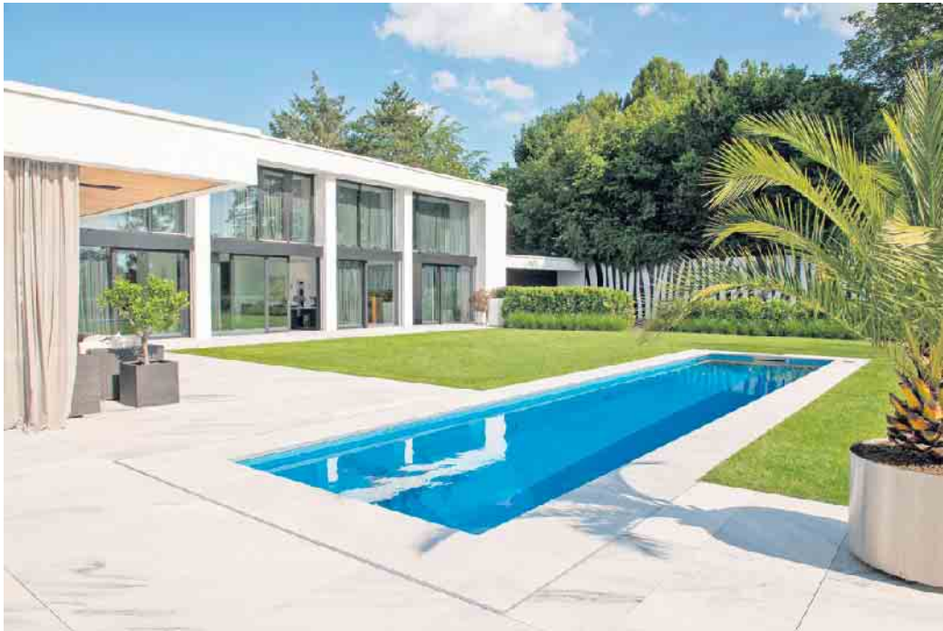
Der Traum vom eigenen Pool: Schwimmbadbauer setzen oft langgehegte Wünsche von Hausbesitzern in die Tat um.

„Der Schwimmbadbau ist ein kreatives Arbeitsfeld mit viel Gestaltungsspielraum. Neben planerischer Kompetenz stehen ästhetisches Verständnis und handwerkliches Können im Vordergrund“, sagt Dietmar Rogg, Präsident des Bundesverbandes Schwimmbad & Wellness e.V. Vielleicht sei diese Vielseitigkeit des Berufs auch genau der Grund, warum es ein Berufsbild Schwimmbadbauer und damit verbunden eine feststehende Ausbildung