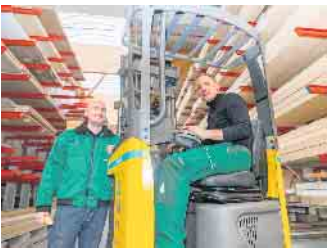
Neben kaufmännischen Berufen bietet der Holzfachhandel eine fundierte Ausbildung auch in der Logistik.

Eine Ausbildung im Holzfachhandel bietet attraktive Perspektiven