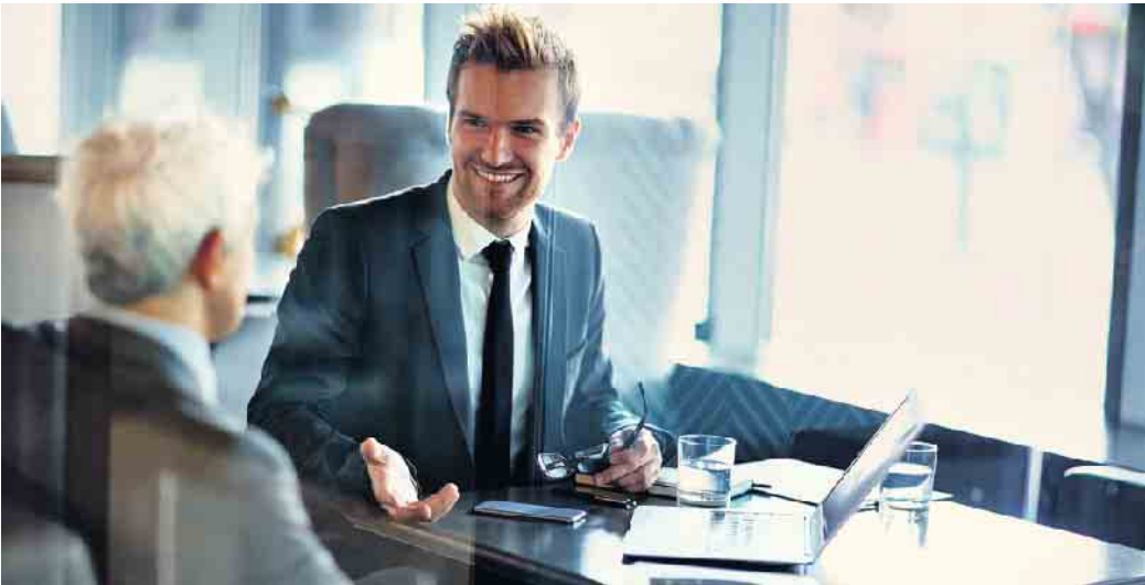
Mit der Hinwendung zu diversen Bewerberpools ergeben sich auch für potenzielle Arbeitnehmer neue Perspektiven, vor allem für ältere Bewerber und Baby-Boomer.

Berufswelt: Von neuen Recruiting-Strategien profitieren alle Beteiligten