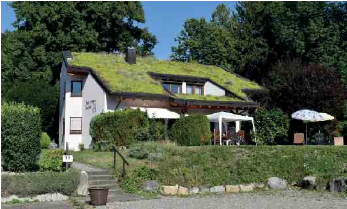
Auch Steildächer können begrünt werden.

Das Dachdeckerhandwerk, ein traditioneller Bauberuf, erlebt in den letzten Jahren eine bemerkenswerte Renaissance dank innovativer Projekte und seiner Bedeutung für den Klimaschutz. Dachdecker und Dachdeckerinnen engagieren sich für Nachhaltigkeit, entwickeln neue Ideen und zeigen damit ihre Fähigkeit, sich den modernen Herausforderungen anzupassen.