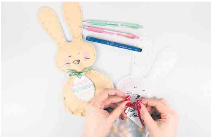
Niedliche Osterhasentüten machen die Eiersuche noch spannender und abwechslungsreicher.

Die Eiersuche ist für Kinder das Highlight an Ostern - Spiel und Spaß sind garantiert. Dabei müssen Schokoeier und Co. aber nicht immer im Nest liegen. Die kleinen Naschereien lassen sich auch kreativ in einer selbst gemachten Hasentüte verpacken. Das macht die Suche gleich noch mal spannender und abwechslungsreicher, wenn in einem der Verstecke ein niedlicher Osterhase wartet! Aber nicht nur für die Kleinen sind die Hasentüten eine schöne Idee, auch als Mitbringsel zum Osterbrunch kommen sie gut an. Denn statt Bonbons, können darin zum Beispiel auch Blumensamen und andere kleine Überraschungen verpackt werden. Mit nur wenigen Materialien und Kreativstiften sind die Hasentüten im Handumdrehen gebastelt. Und so geht's: