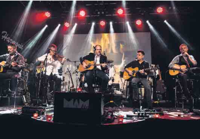
MAM - die BAP-Coverband live und in Konzertlänge am 3. Mai auf dem Sieglarer Marktplatz - Eintritt frei!

Freut euch mit den Junggesellen auf vier Tage volles Programm rund um den Sieglarer Marktplatz - OpenAir mit der Skyliner-Event-Überdachung mit jeder Menge Acts live auf der Bühne!