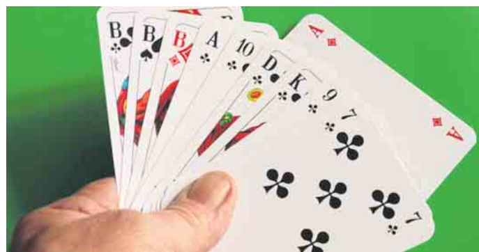
Preisskat für den guten Zweck

Lasst uns zusammen wieder etwas Gutes tun!