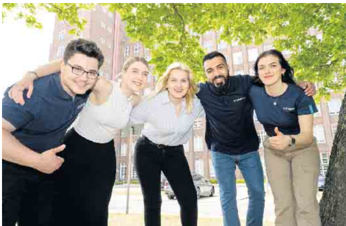
Junge Karrierestarter sollten ihr späteres Betätigungsfeld nach persönlichen Neigungen wählen.

wissen grob, dass sie beispielsweise gerne „irgendwas mit IT“ oder „irgendwas mit Klimaschutz“ machen wollen. Siemens etwa hat auf der Webseite ausbildung.siemens.com dazu diverse Erfolgsstorys bereitgestellt. Diese zeigen anhand verschiedener Fälle jeweils exemplarisch auf, welche Berufe überhaupt zu einer Wunschstätigkeit passen könnten. In manchen Fällen ist auch nicht die Berufsausbildung der erste Schritt in den Traumjob, sondern ein duales Studium. Hier lernt man die Arbeit in der Praxis genauso kennen wie den akademischen Hintergrund an einer Hochschule oder Universität. Interessiert bleiben Wichtig ist für viele Jugendliche auch die Job-Beratung durch ihre Eltern. Laut der Bertelsmann-Studie zählen fast drei Viertel der Befragten auf den fachkundigen Rat von Mama und Papa. Allerdings haben sich etliche Berufe im Laufe der Zeit gewandelt; es sind in den letzten Jahren ganz neue Tätigkeiten hinzugekommen, einige sind dafür ausgestorben. So sei es auch für Eltern wichtig, sich vor dem Gespräch mit dem Kind gut zu informieren, wie die Arbeitswelt heute aussieht und welche Wünsche der Jugendliche überhaupt selbst habe, so Klepke. Ängste, dass im Rennen um einen Ausbildungsplatz nur die Schulnoten alleine zählen, brauche allerdings niemand schüren. „Noten sind nicht alles. Uns ist wichtig, dass wir motivierte Menschen in unsere Teams holen“, sagt Klepke. „Und wenn dann die schulischen Leistungen noch okay sind, haben wir ein Match!“ (DJD)