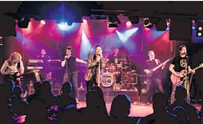
Sir Williams - die Robbie Williams Tributeshow am 30. April auf dem Sieglarer Marktplatz - Eintritt frei!

anstaltungstermine in den bevorstehenden warmen Monaten zu setzen und laden in diesem Jahr gleich zu vier Veranstaltungstagen ein. Um die Vorfreude etwas zu steigern, folgt der erste Teil der Künstlervorstellung für die heißen Tage auf dem Sieglarer Markt: