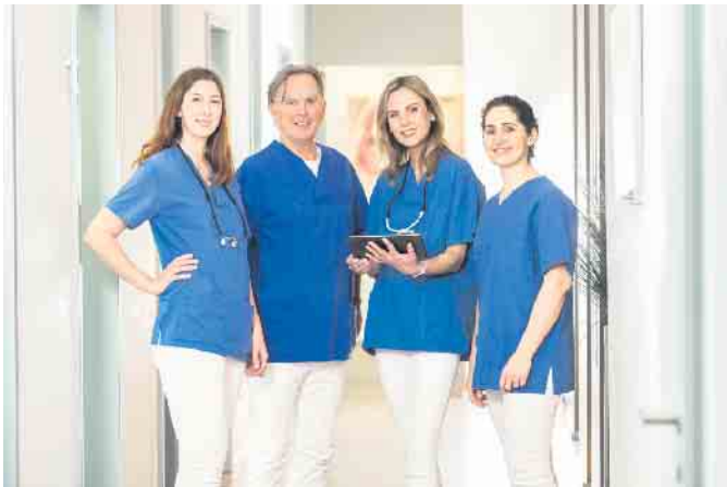
Das Team der dental suite im Kölner Rheinauhafen

Ein neuartiges Konzept (All-on-4®) macht es möglich: Feste dritte Zähne an nur einem Tag! In der dental suite im Rheinauhafen ist dieses Konzept bereits seit Jahren tägliche Routine. Es wurde speziell für Patienten entwickelt, die von vollständigem oder fast vollständigem Zahnverlust betroffen sind. Das Besondere: Lediglich vier Implantate müssen für einen voll-