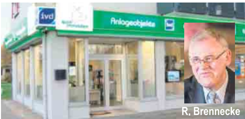
Im Zentrum von Porz: Goethestraße / Ecke Bahnhofsstraße