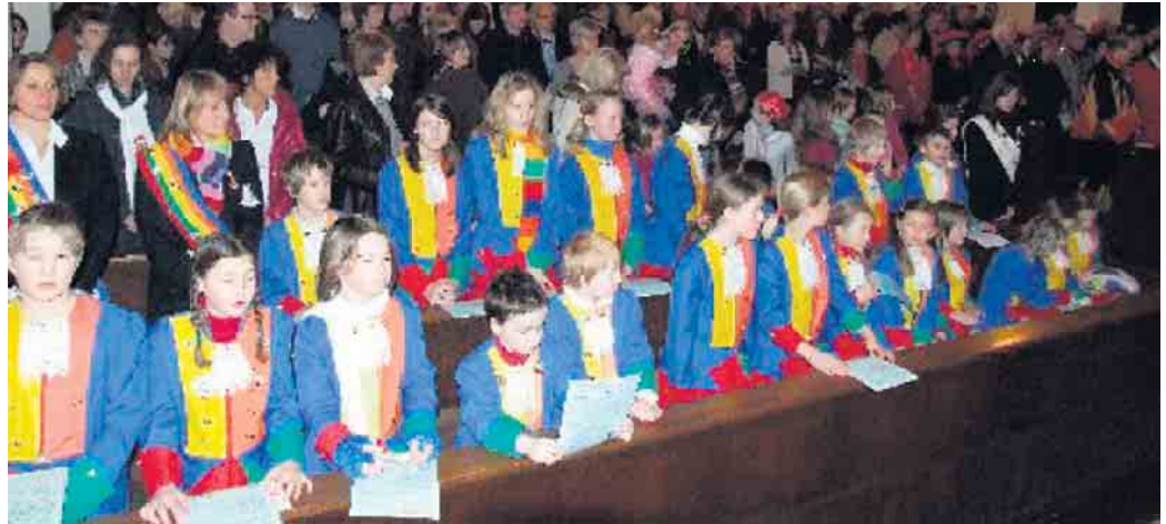
Über Jahre haben die „Hubertusfünkchen“ an der „Kölschen Mess“ in Brück teilgenommen.