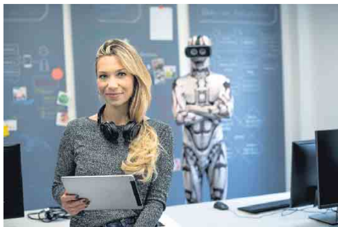
Im Master-Studiengang kann man zur Digital-Expertin werden.

Die digitale Transformation zählt zu den wichtigsten globalen Themen der Wirtschaft: Arbeit, Kommunikation und ein beachtlicher Teil der Freizeit finden immer mehr über digitale Medien statt. Neue Technologien der Industrie 4.0 sowie geringe Einstiegshürden sorgen dafür, dass innovative Geschäftsmodelle schneller auf den Markt kommen. Das stellt Unternehmen und ihre Mitarbeiter vor große Herausforderungen. Um bei den rasanten Marktentwicklungen, den kurzen Innovationszyklen und raschen digitalen Transformationsprozessen rechtzeitig Trends zu entdecken,