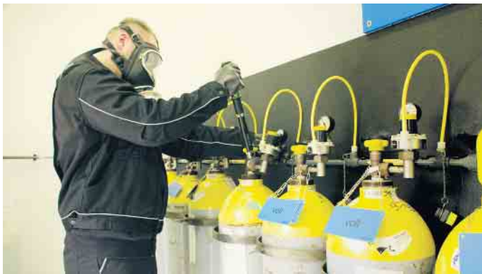
Technisches Wissen und handwerkliches Geschick sind erforderlich für die Berufe rund um die Bäderbetriebe.

Ausbildungsjahr bis zu 1.200 Euro brutto erreichen.