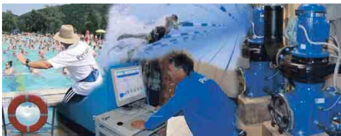
Alles im Blick zu behalten ist ein verantwortungsvolle und ebenso anspruchsvolle Aufgabe.

zialisieren. Durch Weiterbildungen und Fortbildungen zum Meister/in für Bäderbetriebe oder zur Fachwirt/in für Bäderbetriebe/Bäderbetriebsmanagement steigen die Karrierechancen. Auch Führungspositionen in anderen verwandten Branchen sind möglich. Die zertifizierte Bundesfachschule des Bundesverbandes Deutscher Schwimmmeister e.V. bietet dazu Vorbereitungs- und Weiterbildungslehrgänge an. Mehr Informationen zum Berufsbild unter www.bds-ev.de (akz-o)