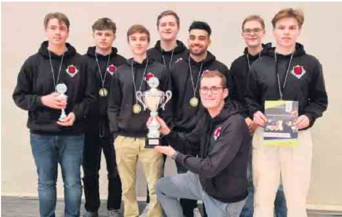
Das siegreiche U20-Team der Porzer.