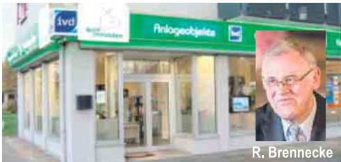
Im Zentrum von Porz: Goethestraße / Ecke Bahnstraße