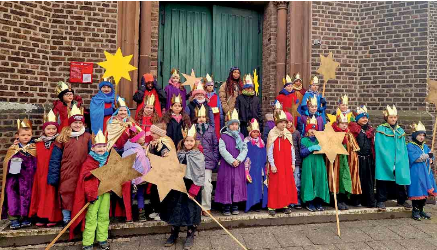
Text: Göllnitz, Foto: Katholische Kirche/Irene Eggert