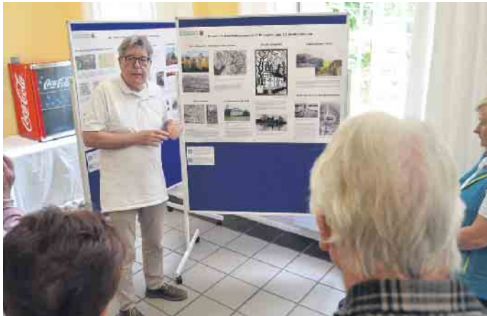
Die Bürgervereinigung Ensen-Westhoven hat eine weitere Fotoausstellung mit Aufnahmen aus ihrem umfangreichen Archiv präsentiert.