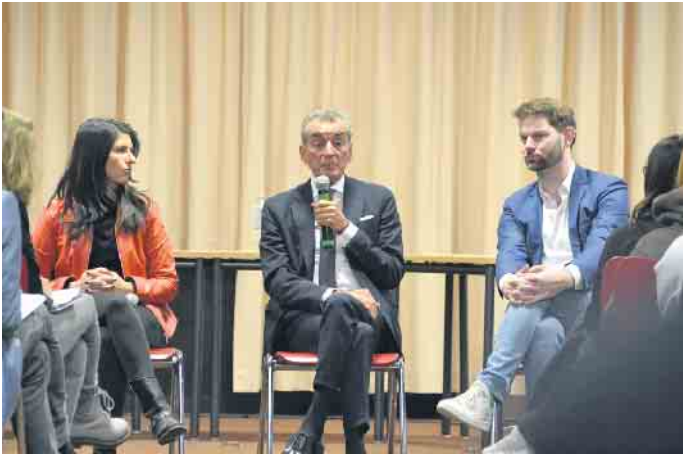
„Hass ist hungrig und wird nie satt“. Der Publizist und Philosoph Michel Friedmann hat das Zündorfer Lessing-Gymnasium besucht - mit dabei Schüler*innen und weitere Gesprächspartner.