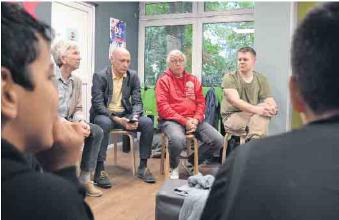
Kurz vor der Europawahl hat der Jugendträger Grembox zum Austausch junger Leute mit Politik und Verwaltung eingeladen.