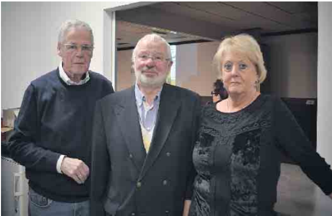
Die Grengeler Siedlergemeinschaft, einst als bürgerliche Vernetzung der Gartensiedlung gegründet, heute etwa auch bei Rechtshilfe aktiv, hat das 90. Jahr ihres Bestehens gefeiert.