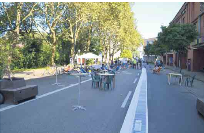
Das Bündnis Porz-Mitte hat zum weltweiten Parking Day die Karlstraße in Porz-Mitte temporär vom Verkehr befreit.