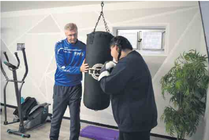
Box-Olympiasieger Torsten May trainiert regelmäßig mit jungen Frauen, die im Jugendwohnen St. Ursula leben. Alle zwei Wochen bietet er im Jugendwohnen St. Ursula ein Boxtraining an.