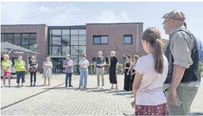
Die Porzer Bürgerstiftung hat ihre große finanzielle Fördergründe für soziale Projekte und Einrichtungen im Stadtbezirk auf den Weg gebracht.