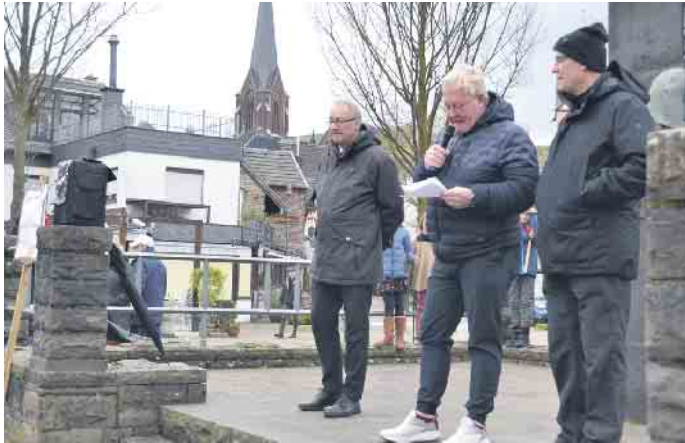
Ortsvereine und Kirchen haben sich am Zündorfer Markt zu einer Kundgebung versammelt. Als Zeichen für die Werte des Grundgesetzes und demokratische Werte.