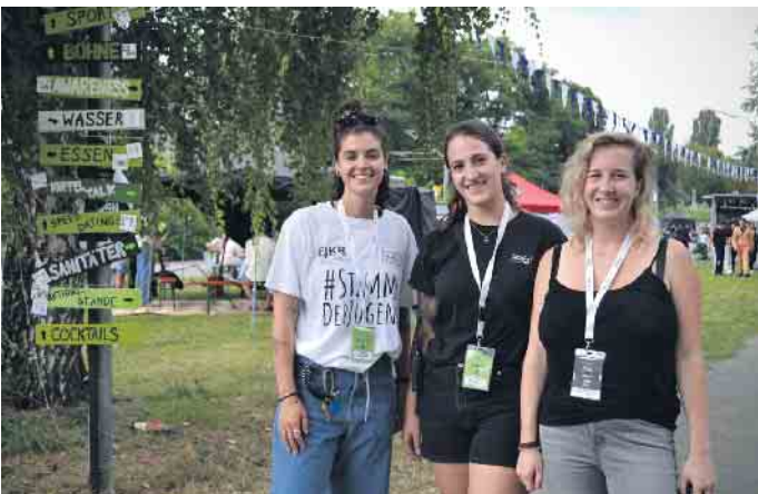
Das „Turn up in CGN“-Festival vom Jugendring Köln und mit reichlich Angeboten hat dieses Jahr in Porz-Mitte Halt gemacht.