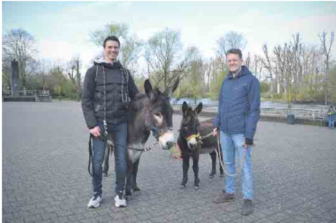
Zum Palmsonntag haben auch zwei Esel auf dem Marktplatz in Zündorf vorbeigeschaut - beide leben sonst in „Rolf's Streichelzoo“ in Zündorf.