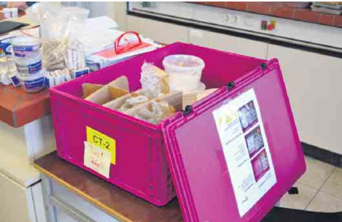
Alles fertig zusammengestellt: In diesen Boxen werden die Lehrinhalte klassenweise angeliefert.

Kreis Bonn-Rhein-Sieg haben die dortigen IHKS das Projekt etabliert. Düsseldorf folge 2025, so Ingrid Böhm-Laubhold. Wartung und Zustellung der Lernboxen über einen Logistiker übernimmt die IHK. Für das Finanzielle sorgt ein Förderpartner. Am Stadtgymnasium hat gerade jüngst die TÜV Rheinland Stiftung diese Rolle übernommen. Während der Lernansatz immer aktiv ist, es um Ausprobieren und Dokumentation geht, so sind die