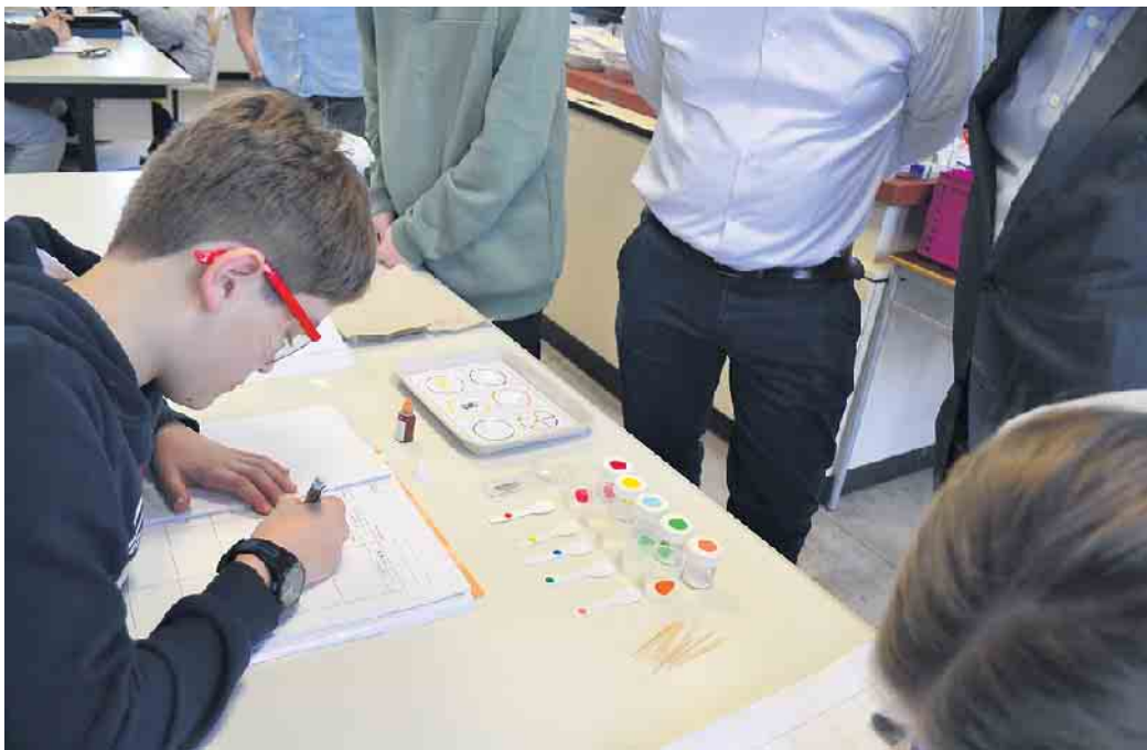
Die Schüler*innen probieren aus, dokumentieren und lernen gleichzeitig.