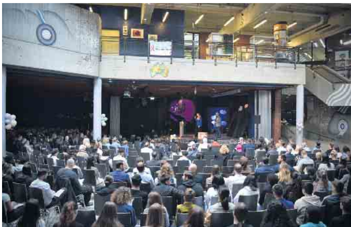
Die Lise-Meitner-Gesamtschule hat ihre Aktivitäten zum 50. Jubiläumsjahr mit einem Festakt und Schulfest abgeschlossen.