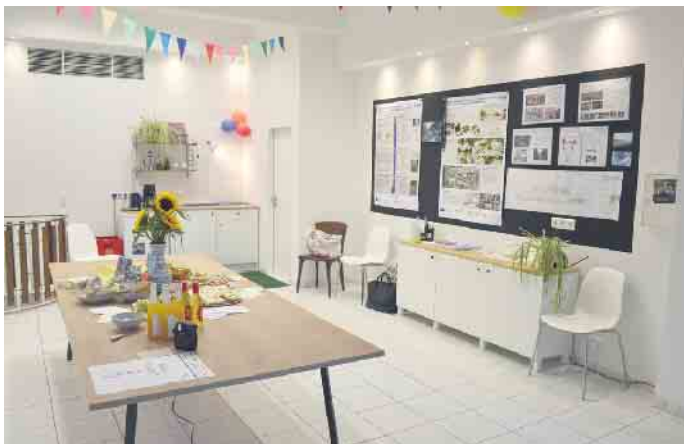
Ebenfalls im September: Das Büro für Vernetzung in Porz-Mitte hat eröffnet und der TV Ensén-Westhoven feiert das 50. Jahr seiner Korfball-Abteilung.