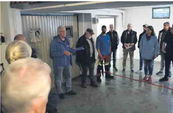
In vielen Linder Kellern stand wochenlang Wasser. Die Gründe waren zunächst nicht klar, letztlich dürften mehrere Faktoren die Lage und Probleme verursacht haben.