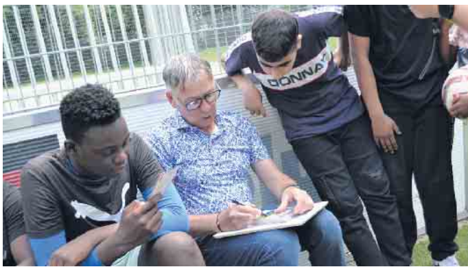
Die beiden Bolzplätze des Jugendzentrums Grembox sind gereinigt worden, zudem gab es eine Flutlichtanlage - finanziert hat die Maßnahme der Verein GOFUS, in dem sich ehemalige Profi-Fußballer engagieren. Ex-Profi Stephan Engels ist Pate des Projekts.