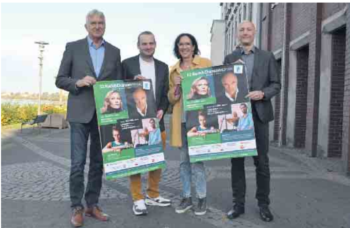
Im Rathaussaal hat die Kulturgesellschaft Polonica wieder ein internationales Musikfestival mit Künstler*innen und jungen Talenten aus Deutschland, Polen und Frankreich abgehalten.