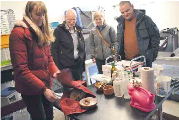
Im Umweltbildungszentrum Gut Leidenhausen hat die Wildtierauffangstation ihre Arbeit aufgenommen - und ist direkt voll ausgebucht. Rund 70 Tiere werden auf zwei Etagen betreut.