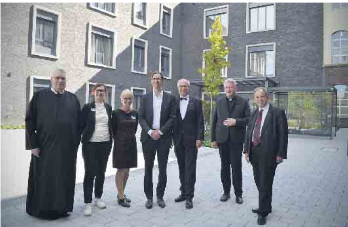
Das Alexianer-Fachkrankenhaus hat seinen Neubau auf dem eigenen Campus und mit modernen Stationen eröffnet.