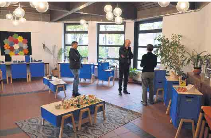
Die mobile Ausstellung der Museen Köln „In the Box“ hat in Finkenbergl Station gemacht. Das Thema: gemeinsames Leben und Wohnen.